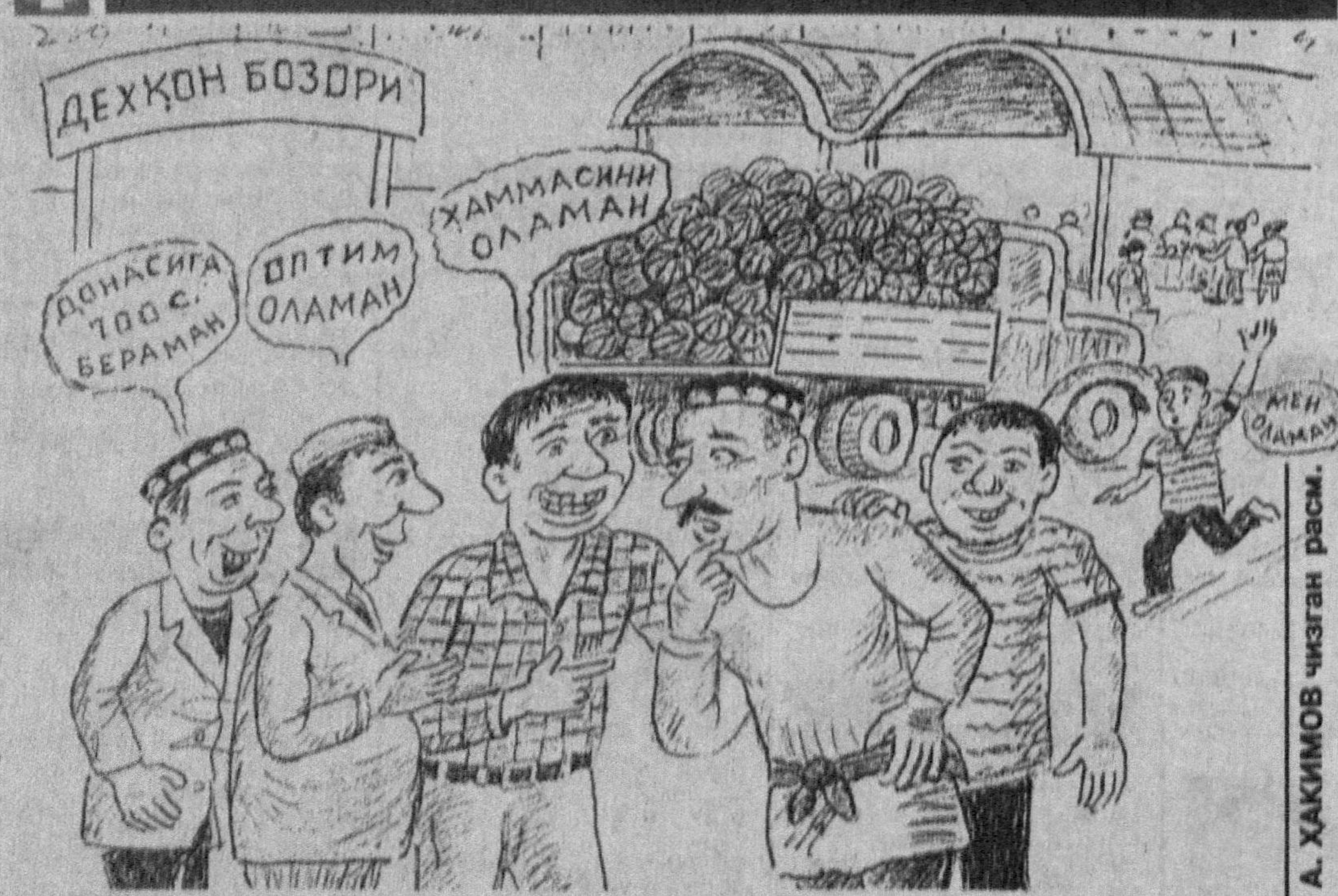
А. ХАКИМОВ чизган расм.