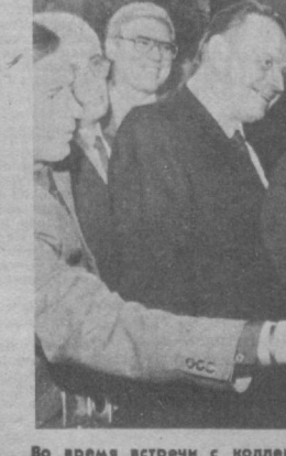
Во время встречи с коллективом завода.

Деловые встречи, открытые беседы руководителей партии и государства с трудовыми коллективами стали неотъемлемой чертой перестройки, расширяющейся демократии. Как уже сообщалось, 4 марта состоялся встреча Генерального секретаря ЦК КПСС М. С. Горбачева с трудящимися Первого государственного подшипникового завода. Созданный в годы первой пятилетки, ГПЗ-1 стал основой отечественной подшипниковой промышленности. Здесь трудятся более 20 тысяч рабочих и специалистов. Продукция этого трижды орденоносного, крупнейшего в отрасли предприятия хорошо известна не только у нас, но и за рубежом. Изготовленные коллективом завода подшипники весом буквально от нескольких граммов до нескольких тонн работают в машинах и станках на земле и в космосе, в бытовой технике и сложнейших научных приборах. Многотысячный коллектив завода находится в постоянном поиске новых форм организации и стимулирования труда, возможности повышения качества продукции, роста эффективности производства. Мы придаем большое значение сегодняшней встрече, — сказал М. С. Горбачев, обращаясь к работникам завода. — И думаю, не надо пространно объяснять — почему. Сейчас, в начале второго этапа перестройки, для всех очевиден стремительный ритм нашей общественной жизни, все видят, какие мощные социальные силы приведены в движение, какие интересные процессы развиваются в обществе.