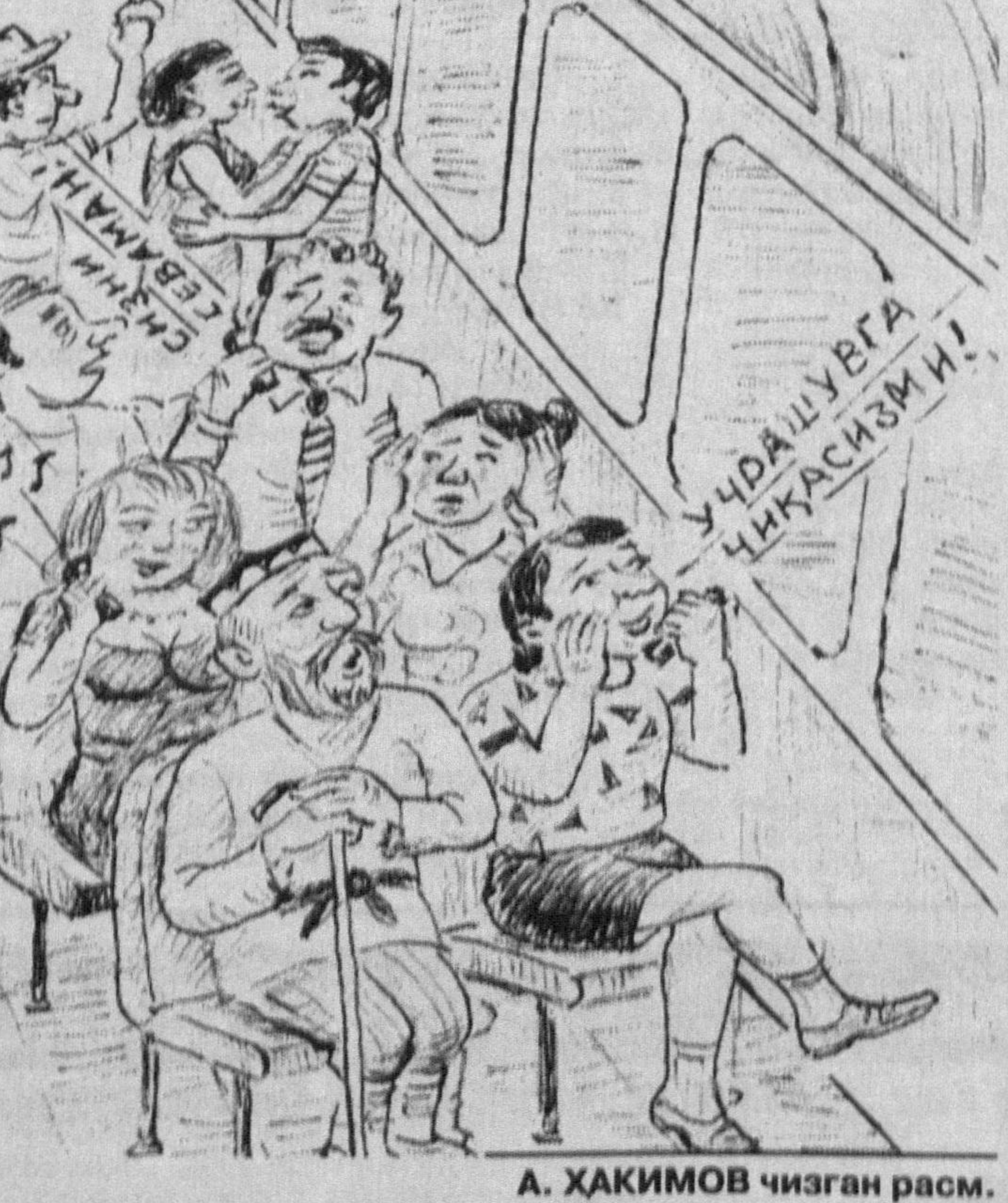
А. ҲАКИМОВ чизган расм.