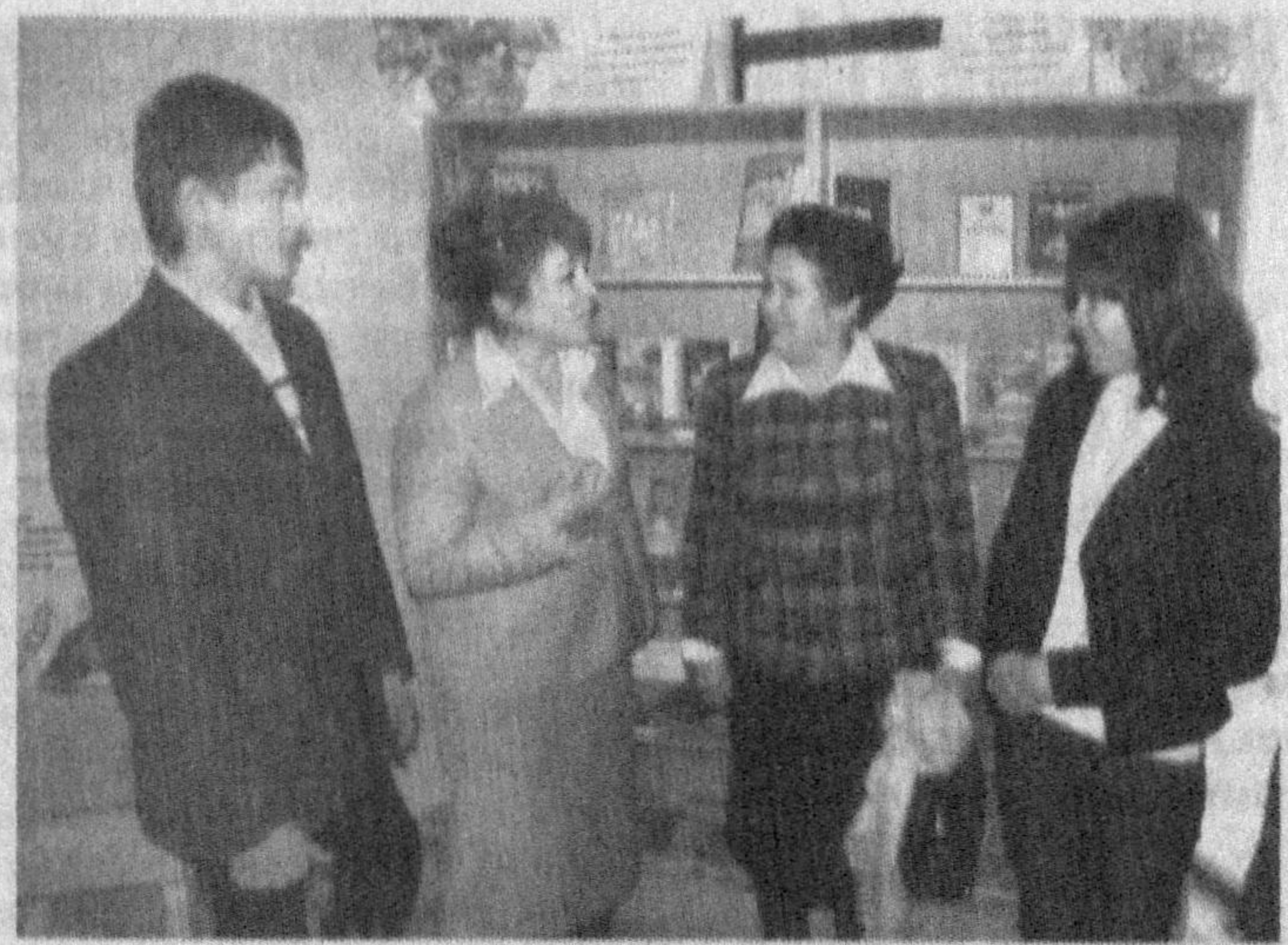
СУРАТААААА: семинар жараёнидан лавҳалар.

Семинар иштирокчилари савол-жавоб тарзида ўзаро фикр алмашдилар. Шунингдек, "Менинг ҳуқуқларим" мавзусида мастер-класс машғулотини ҳам уюштирилди.