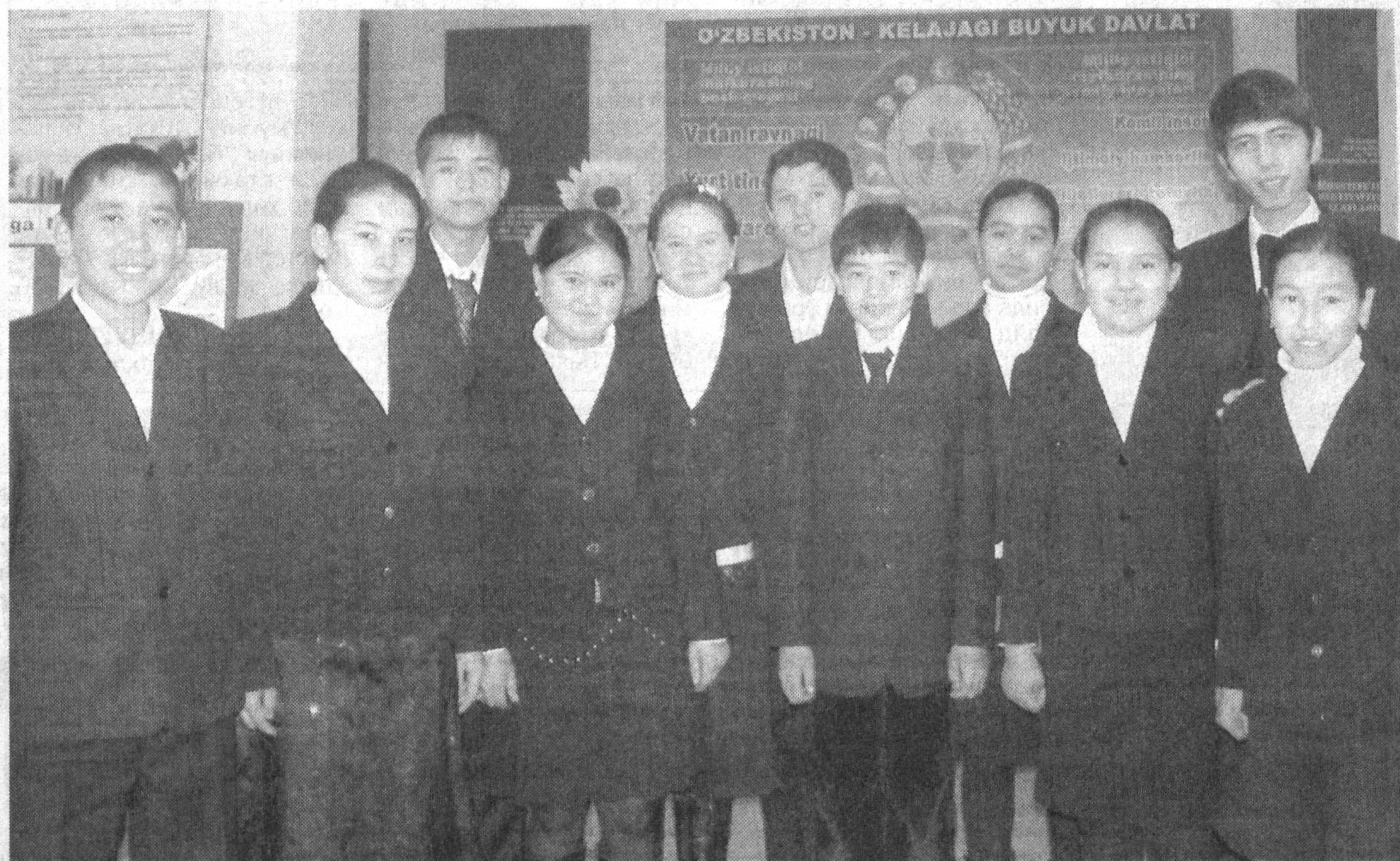
Тумандаги 28-умумтаълим мактаби 1978 йилда фойдаланишга топширилган. Шу кунгача зиё маскани минг-минглаб ўқувчиларни мустақил ҳаётга учирма қилди.