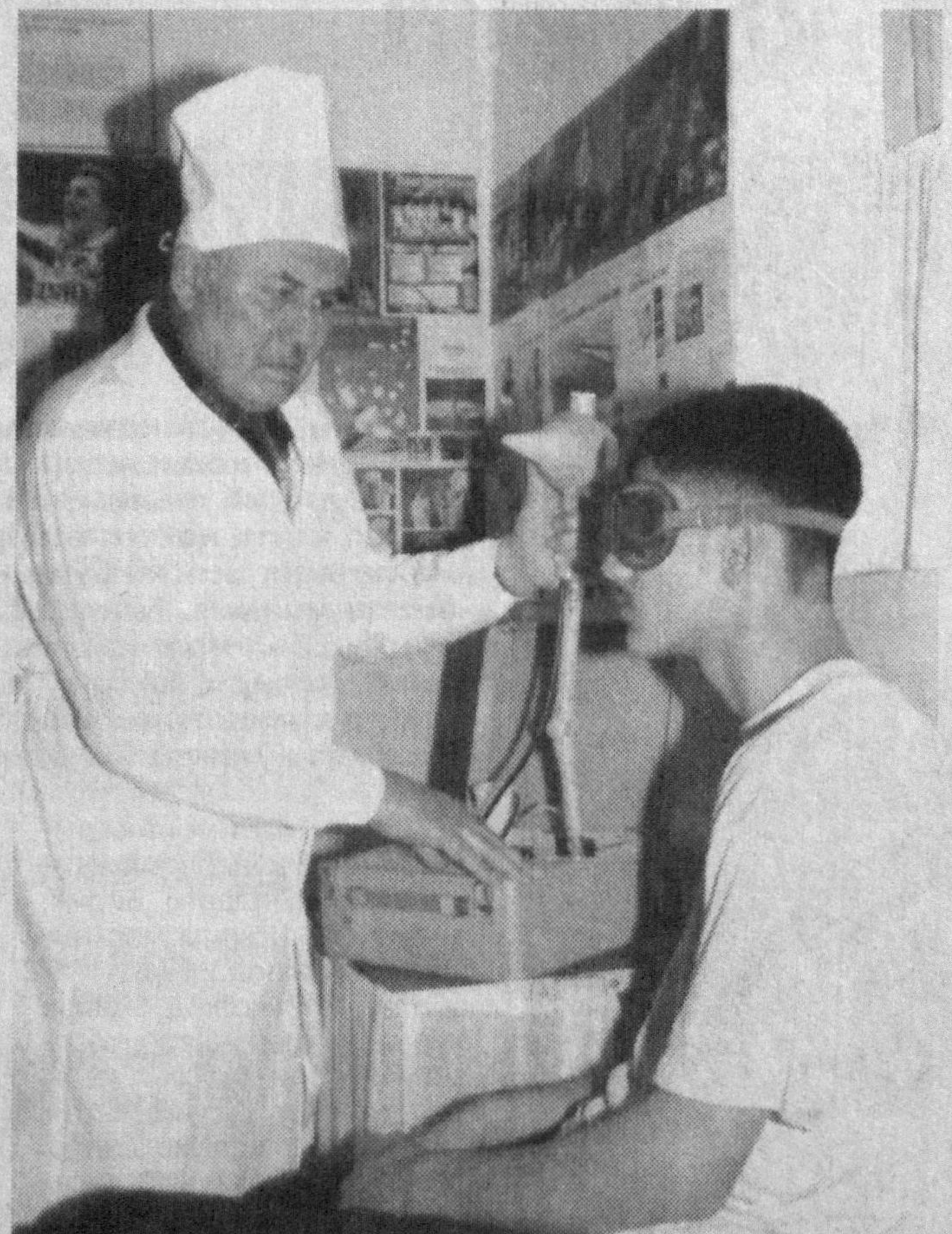
Шифокор мамнун. Нега?