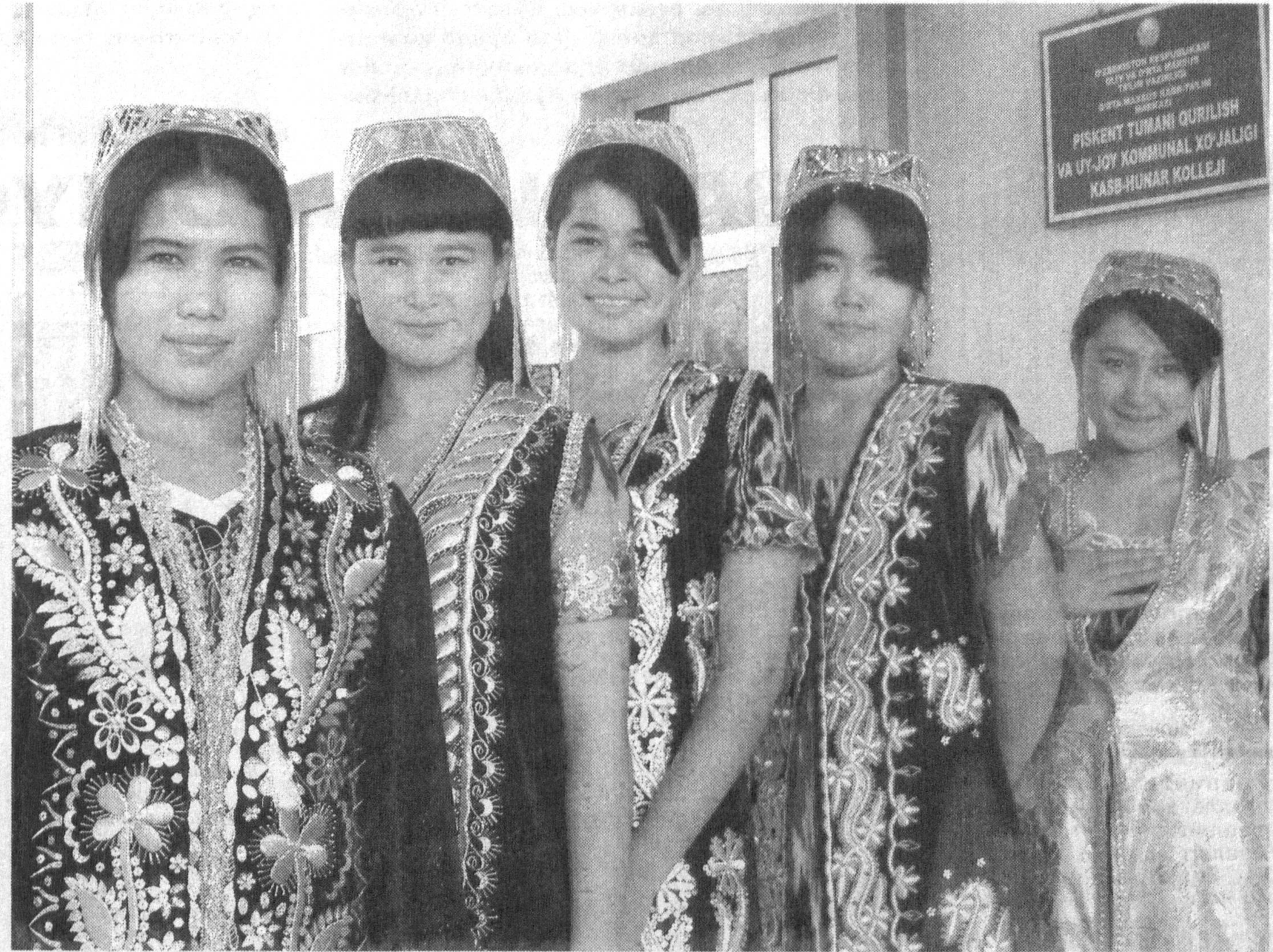
СУРАТДА: тумандаги Қурилиш ва уй-жой коммунал хўжалиги касб-хўнар коллежи ўқувчи қизлари ўзлари тиккан миллий кийимлардан намуналарни намойиш қилишмоқда.

Жаҳонгир МАЪРУПОВ, туман ҳокимининг ўринбасари.