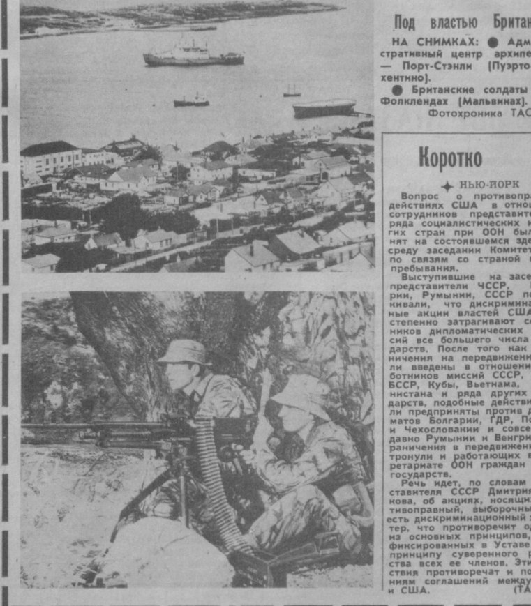
Под властью Британии НА СНИМКАХ: ● Административный центр архипелага — Порт-Стэнли (Пурро-Архипелаг). ● Британские солдаты на Фолклендах (Мальвинах).