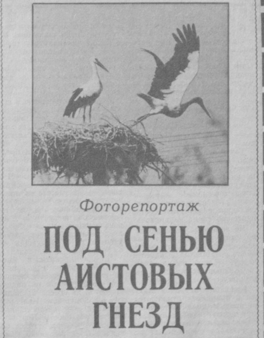
Фоторепортаж ПОД СЕНЬЮ АИСТОВЫХ ГНЕЗД