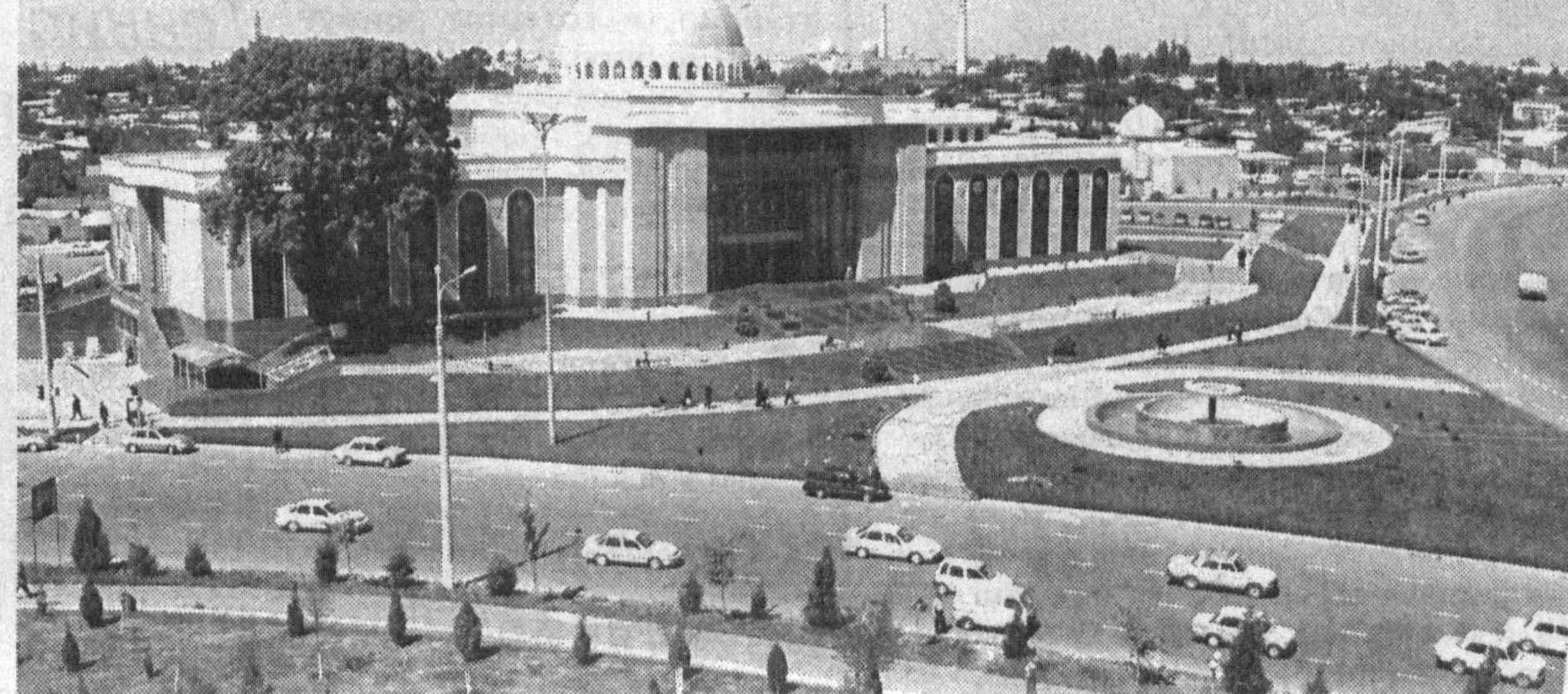
Архитектурный облик столицы всегда радует глаз.