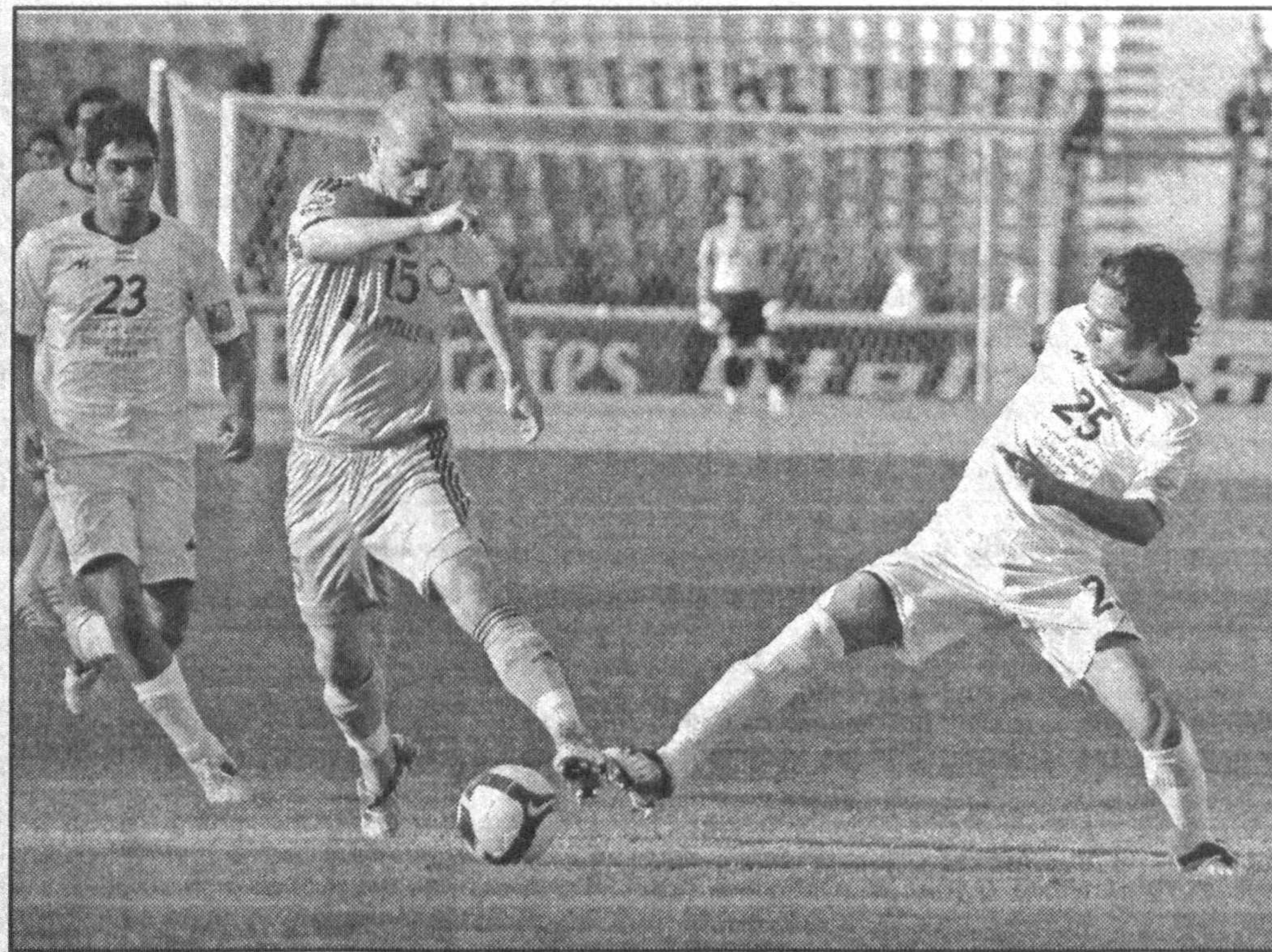
Спорт — занятие для сильных и волевых.