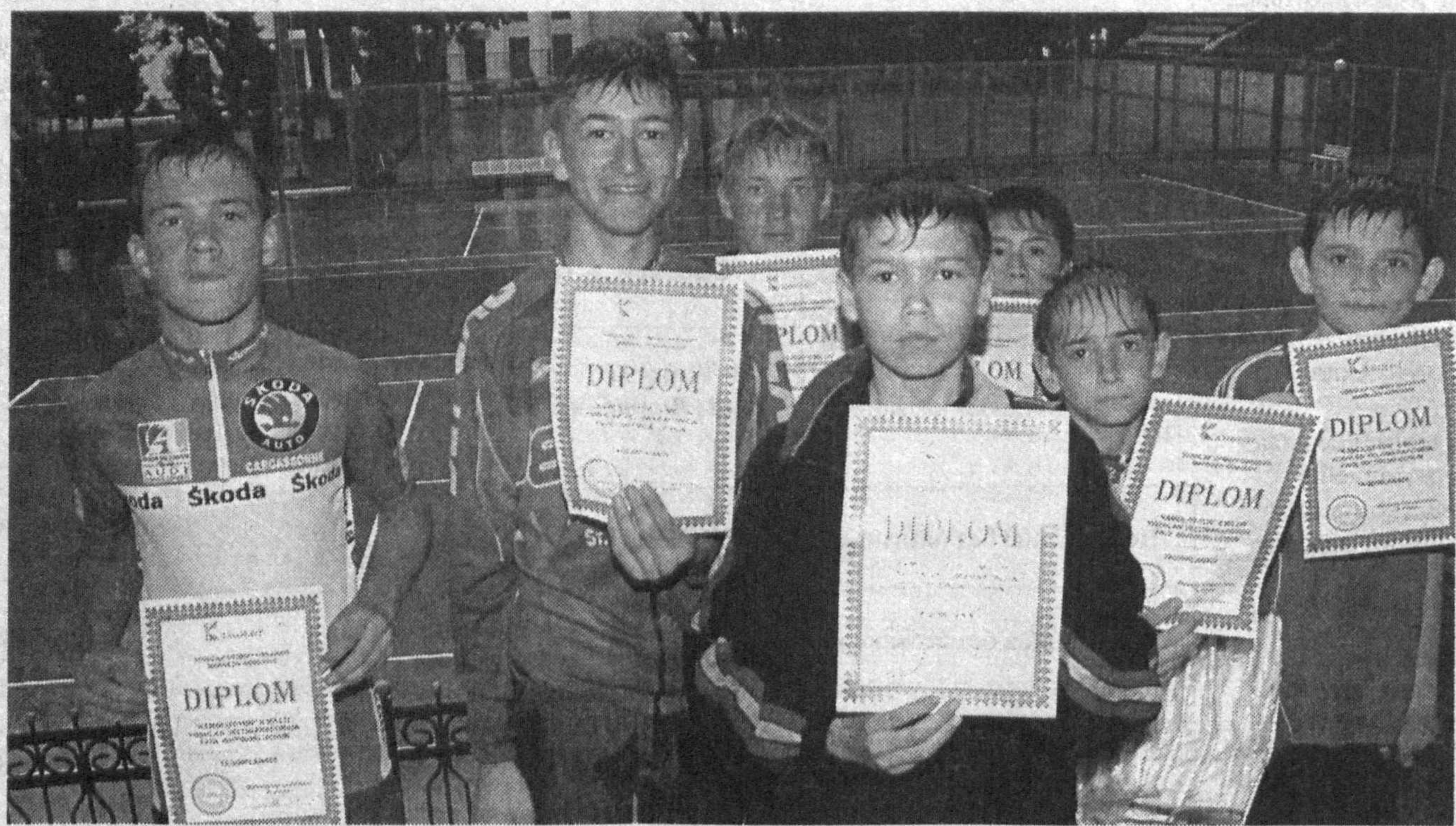
Около двух тысяч любителей участвовали во втором молодежном национальном веломарафоне «Камолот-тур». Самые активные из них были награждены памятными подарками, дипломами.