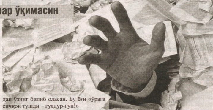
дан ўзинг билиб оласан. Бу ёғи «ўрага сичқон тушди — гулдур-гуп!»

«Кечирасиз, синглим, сиз қайси ташкилотда ишлайсиз? Марҳамат қилиб, кераксиз жадваллар билан бошингизни оғритаётган ташкилотнинг юридик номи ва манзилини бизга билдириб-чи?» деб сўролмайсиз. Ўзи кўзёши тўкиб ўтирган бир мусибатзада бўлса... Мабодо сўраб қолсангиз, дарров ўзини ўнглаб олиб: «Вой, акажон, сал шамоллаб қопман-да, шунга алжираб ўзим билмаган ҳар хил гапларни айтадиган бўлиб қопман. Аҳамият берманг-а?..» дейиши табиий. Сўнг орқа-олдига қарамай автобус эшиги очилиши билан ўзини ташқарига уриши аён. Бундай