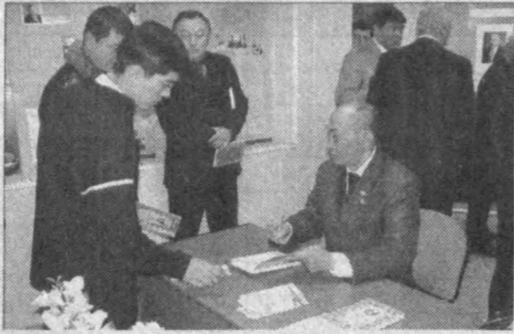
эти строки счастья, боли и грусти, любви и справедливости.

В Ташкенте в филиале Академии Плеханова состоялась презентация новой книги героя Узбекистана, Народного поэта Абдуллы Арипова «Благословенно прожитое мною».