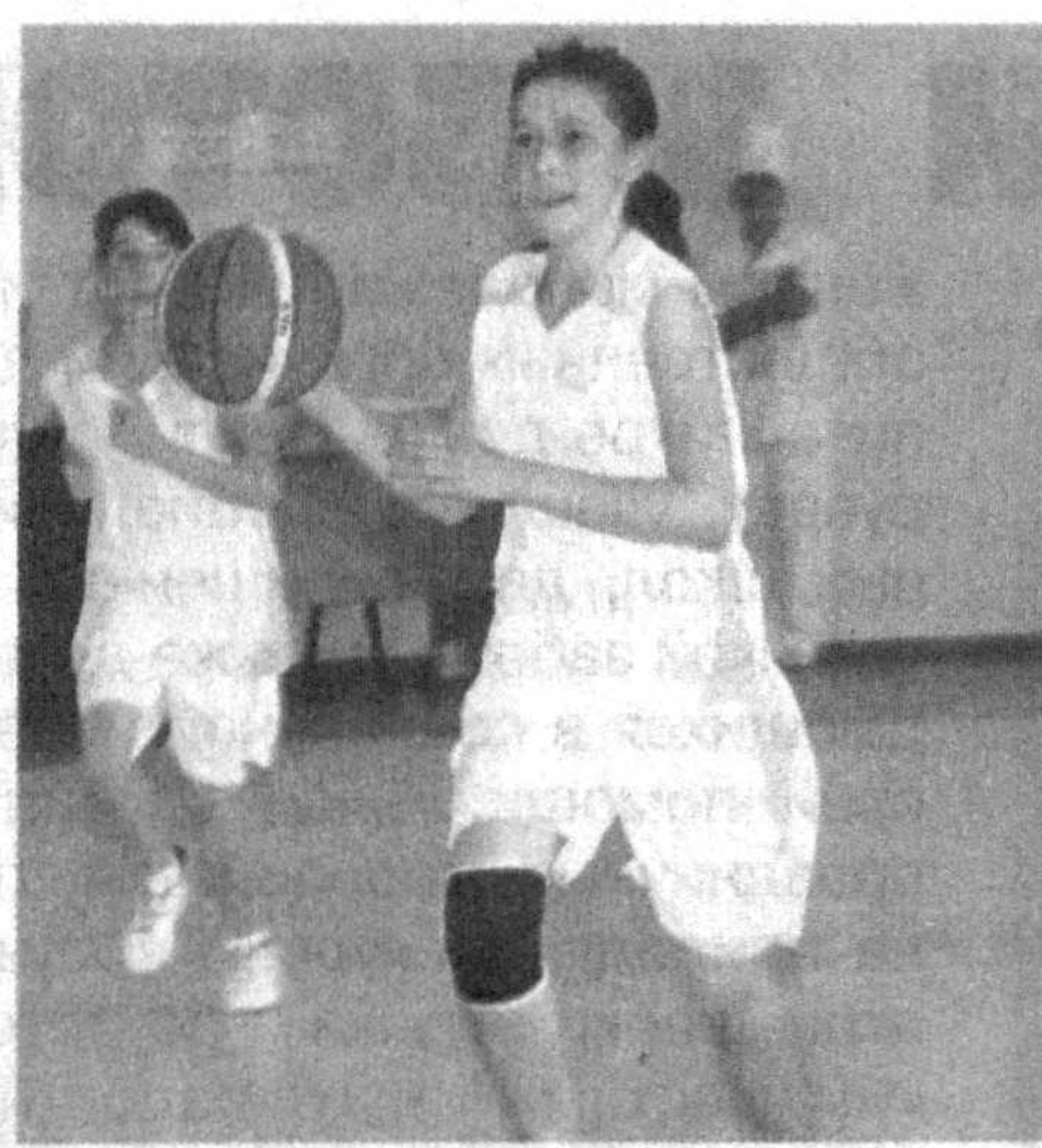
Детский спорт – путь к совершенству.