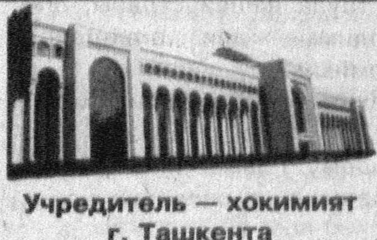
Учредитель — хокимият г. Ташкента

По вопросам доставки обращаться в почтовые отделения по месту жительства или в отдел эксплуатации ГСП «Ташкент почтагити» по телефону 233-74-05.