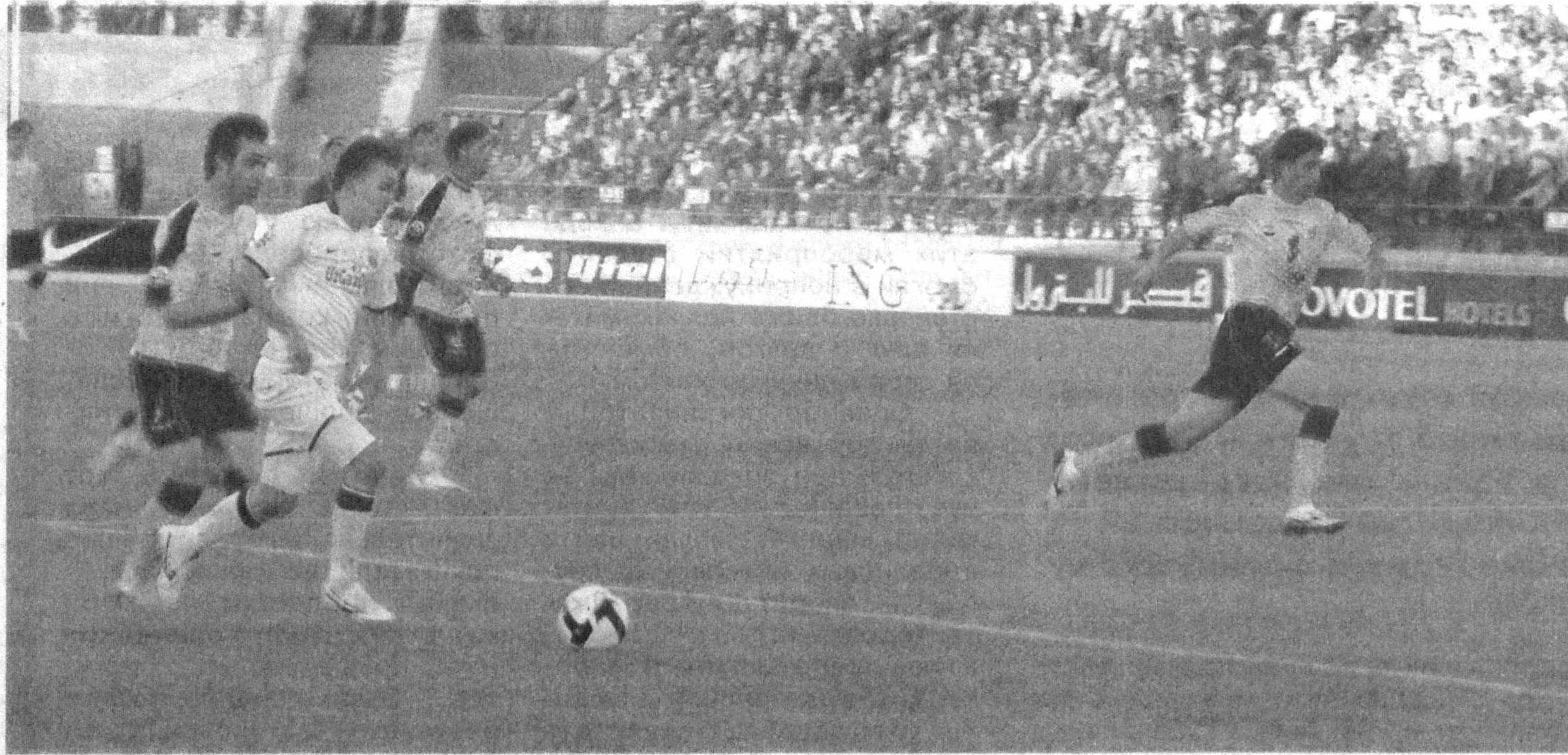
Игра в разгаре.