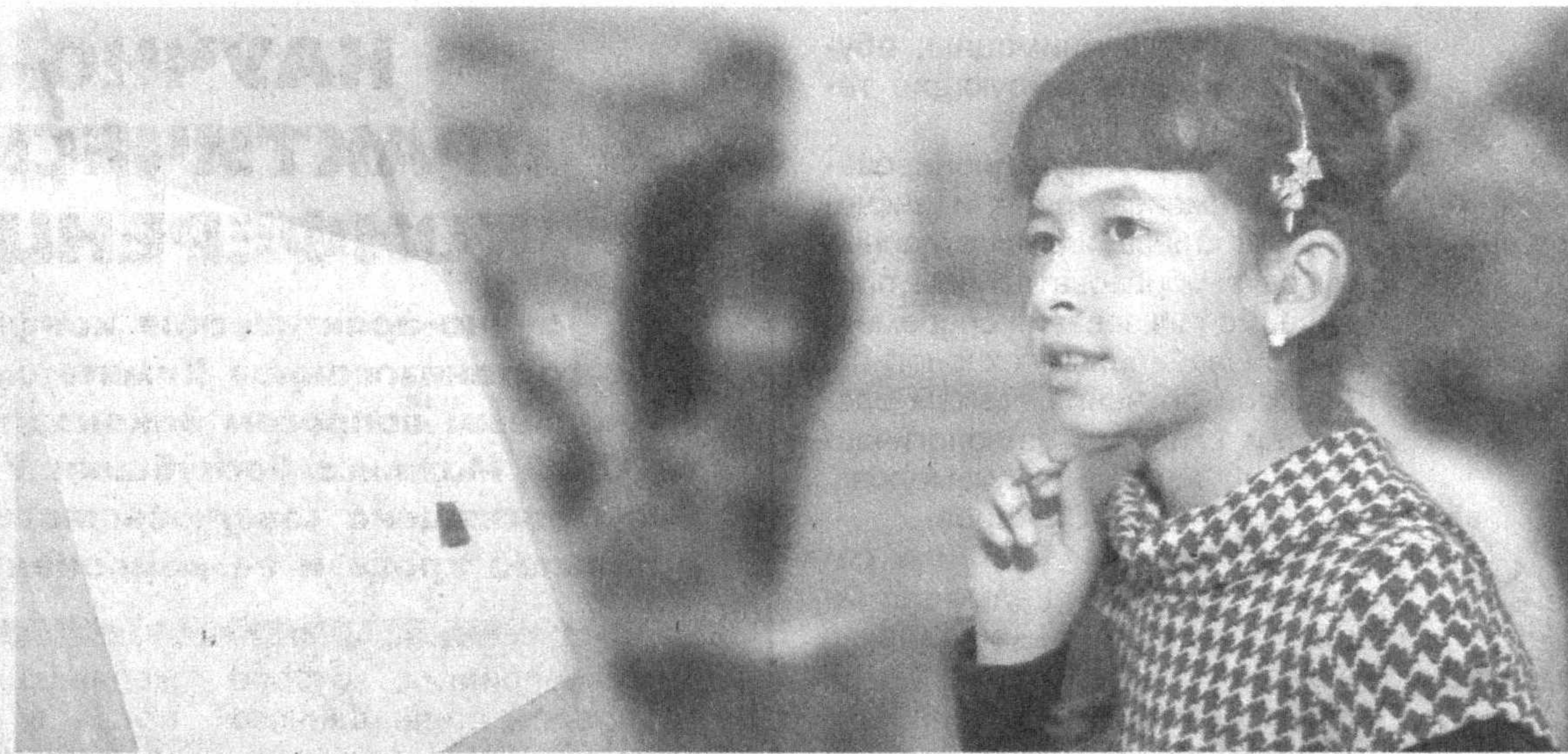
Красоту мира открывают детям занятия в кружках центров творчества учащихся.