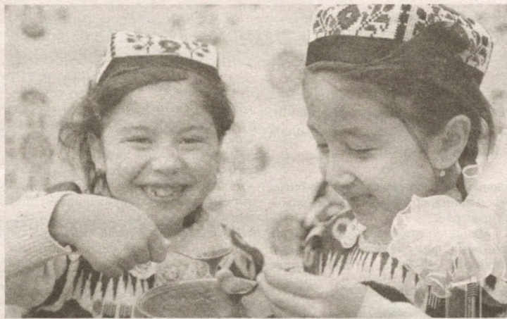
— Сумалакдан тотиб кўрайлик...

Баъзи удумларга кўра, қадимда Наврўз қирадиган хун арафасида бир идишга ҳар хил мева ҳамда ўзбўйгуллари солиб, хоннинг олдида бориб: «Эртага Наврўз қиради, шуни халққа маълум қилишга