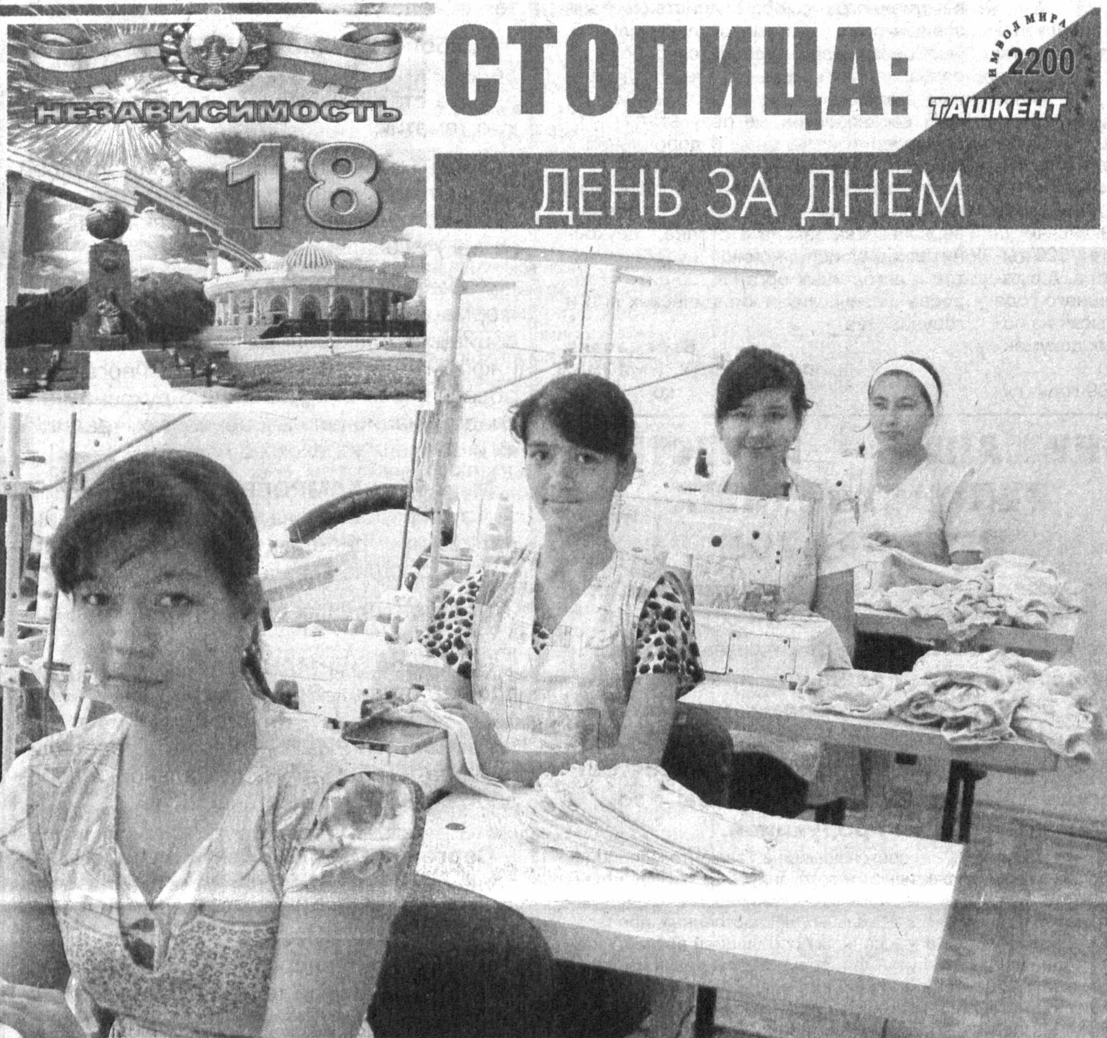
Малый бизнес в большой экономике