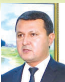
Қаҳрамон САРИЕВ, Қорақалпоғистон Республикаси Вазирлар Кенгаши раиси:

Эндиликда қайта ташкил этилган Кадастр агентлиги ер ва бино иншоотларининг ҳисоби билан шуғулланади. Ҳақиқатан ҳам солиқ идоралари ва кадастр тизими ўртасида номуносивиблик бўлган. Президентимиз топшириғига кўра, ана шу тафовутни йўқотиб, тизимини уйғунлаштирамиз.