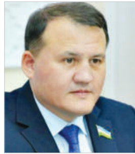
Ахмат ХАЙТОВ, Олий Мажлис Қонунчилик палатаси Спикери ўринбосари, УзЛиДеП фракцияси раҳбари

Бугун Ўзбекистон ўз мустақил тараққиётининг сифат жиҳатдан янги босқичга қадам қўйди. Бу йилда у жаҳоннинг кўплаб мамлакатлари ва йирик халқаро ташкилотлари билан турли соҳаларда ҳамкорлик қилиб келмоқда.