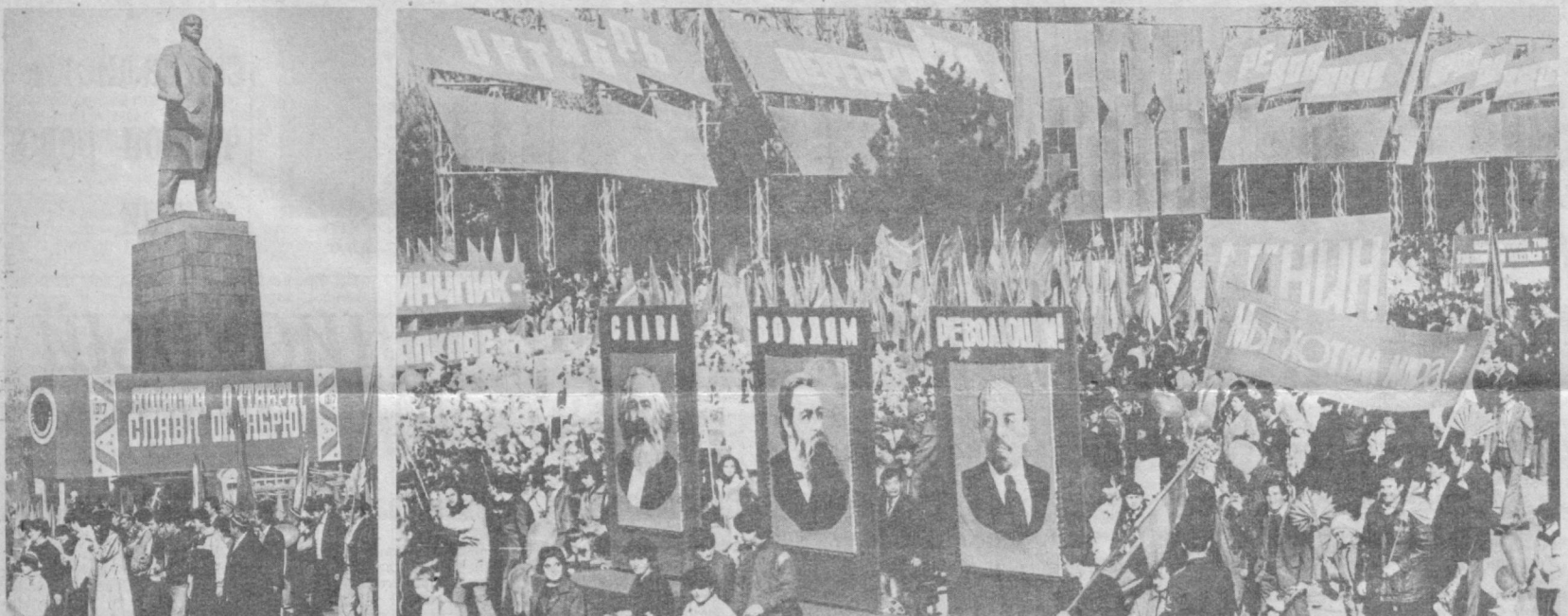
ТАШКЕНТ. Площадь имени В. И. Ленина. Демонстрация трудящихся и военный парад.