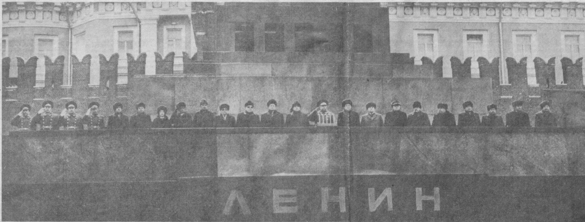
МОСКВА, 7 ноября 1988 года. Военный парад и демонстрация трудящихся на Красной площади. НА СНИМКЕ: на трибуне Мавзолея В. И. Ленина.