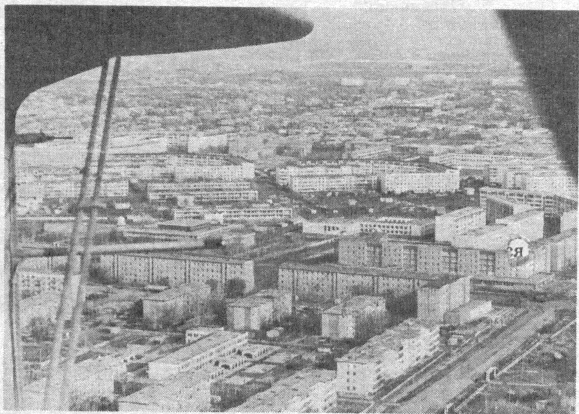
◆ Республика Каракалпакстан по праву гордится своими кадрами зодчих, которые обладают достаточным опытом для решения сложных задач градостроительства. Это видно, в частности, в практике застройки Нукуса (на снимке запечатлен один из районов столицы).