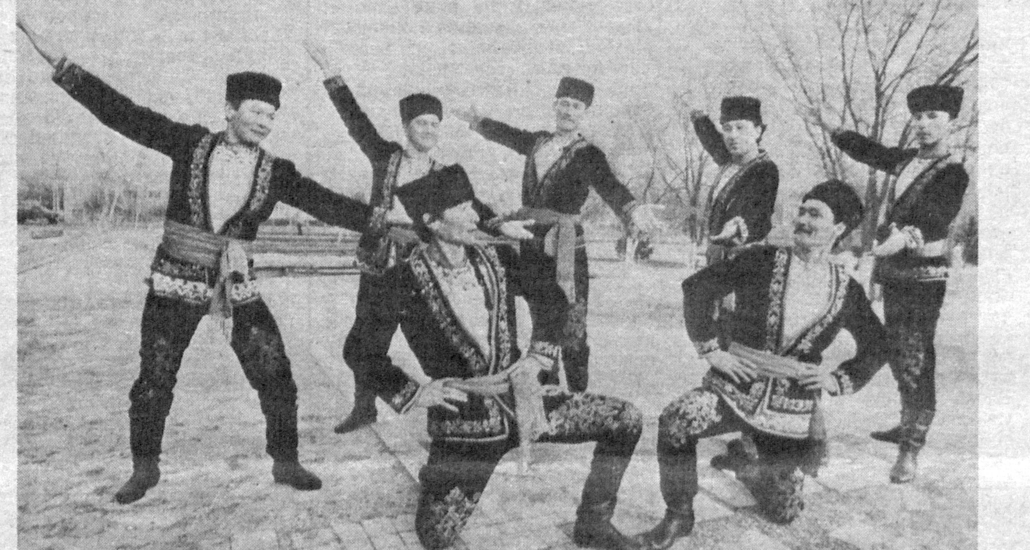
◆ Каракалпакский государственный ансамбль песни и пляски (художественный руководитель — народный артист Узбекистана Пулат Мадримов) побывал с гастролями во многих государствах ближнего и дальнего зарубежья. Участники ансамбля на репетиции.

Недавно широко отмечалось 60-летие Нукуса. В юбилейных мероприятиях активное участие приняли и художники, выставившие немало прекрасных произведений. Самые лучшие из них включены в экспозицию выставки. Они отображают братство народов Каракалпакстана и Узбекистана, их нерушимую дружбу. Дни культуры для нас, художников, явятся и серьезным экзаменом на зрелость. «Узбекистон овози», № 14, 1993 г.