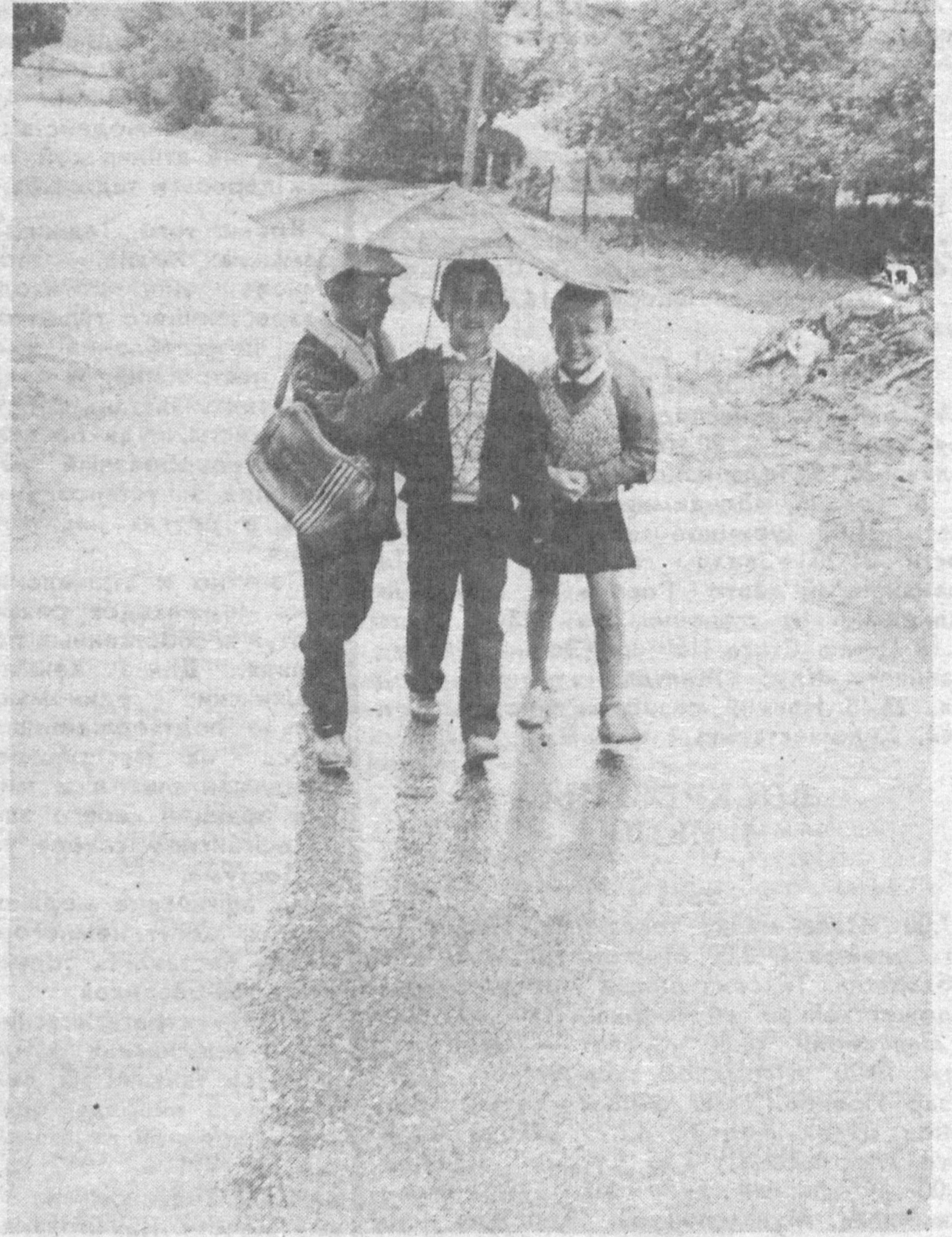
Этот ласковый дождь.

Две недели — срок вполне достаточный для овладения шестым упражнением. Для более четкого вызывания чувства прохлады можно вызвать представление о легком ветре, прикладывая ко лбу прохладный предмет.