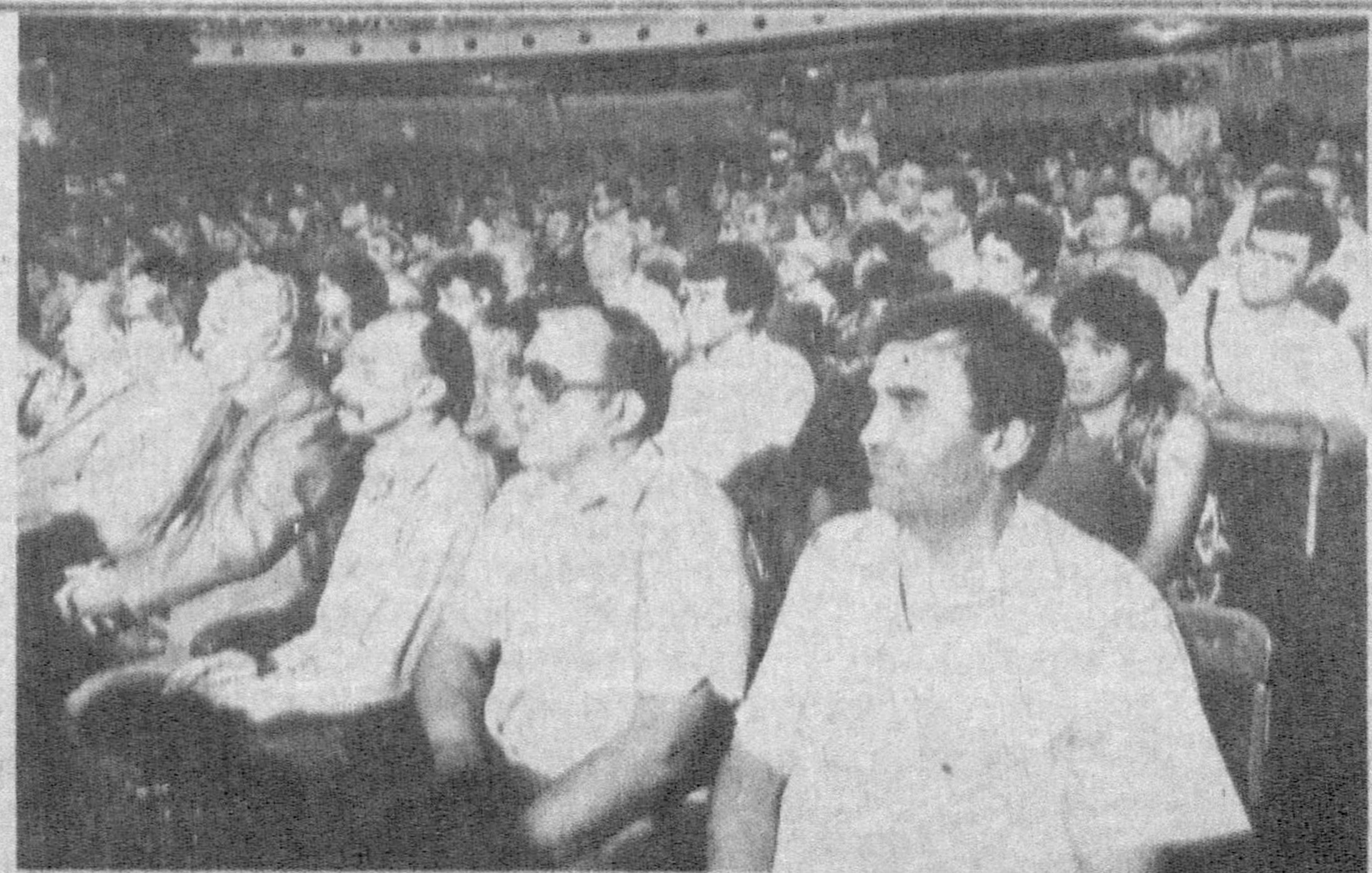
НА СНИМКАХ: во время торжественного собрания.

На Политисполкоме утверждён план работы ЦС НДП на II полугодие 1993 года, рассмотрены кадровые и другие вопросы внутривнутрипартийной жизни.