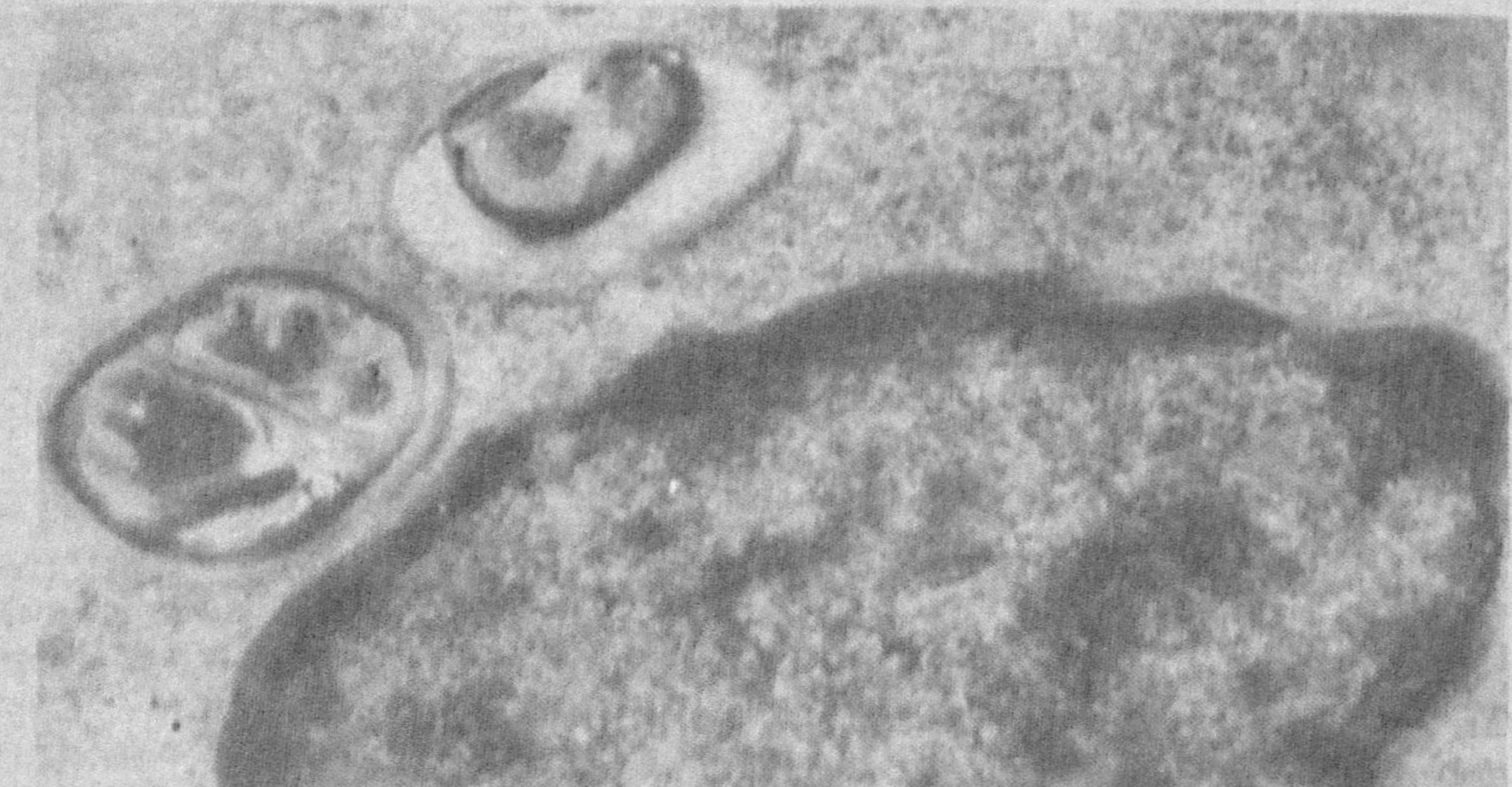
На этом снимке, полученном с помощью электронного микроскопа с 20-тысячным увеличением, запечатлена тканевая клетка зараженного человека. В центре — ядро лимфоцита. Два шалонных «кружляшка» сверху — это и есть заминеллы в процессе размножения.