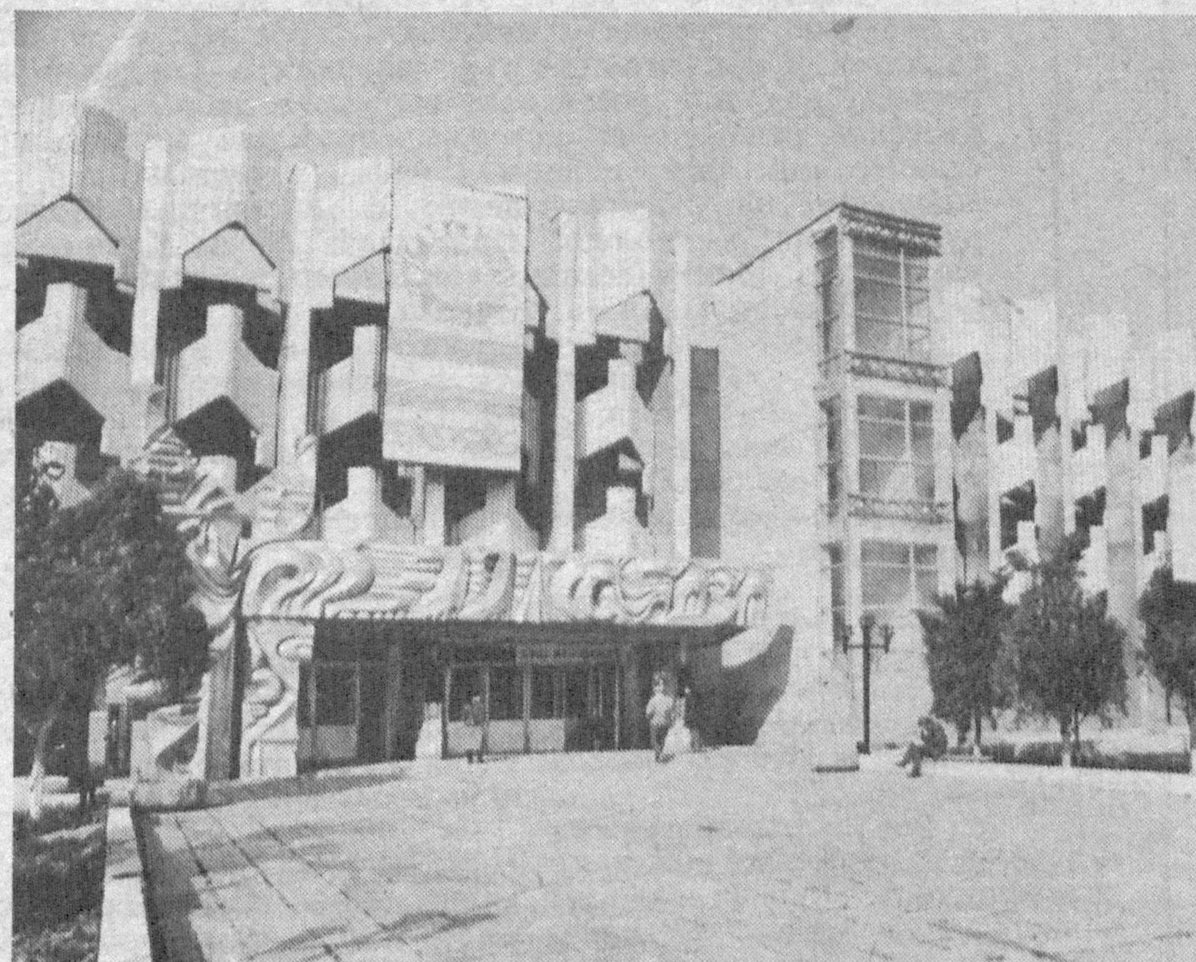
На снимке: вот такая прекрасная проходная на Джизакском заводе пластмасс.

— Человек, на мой взгляд, должен идти на работу не для того, чтобы отбывать повинность, а с хорошим, светлым чувством. В этом чувстве обяза-