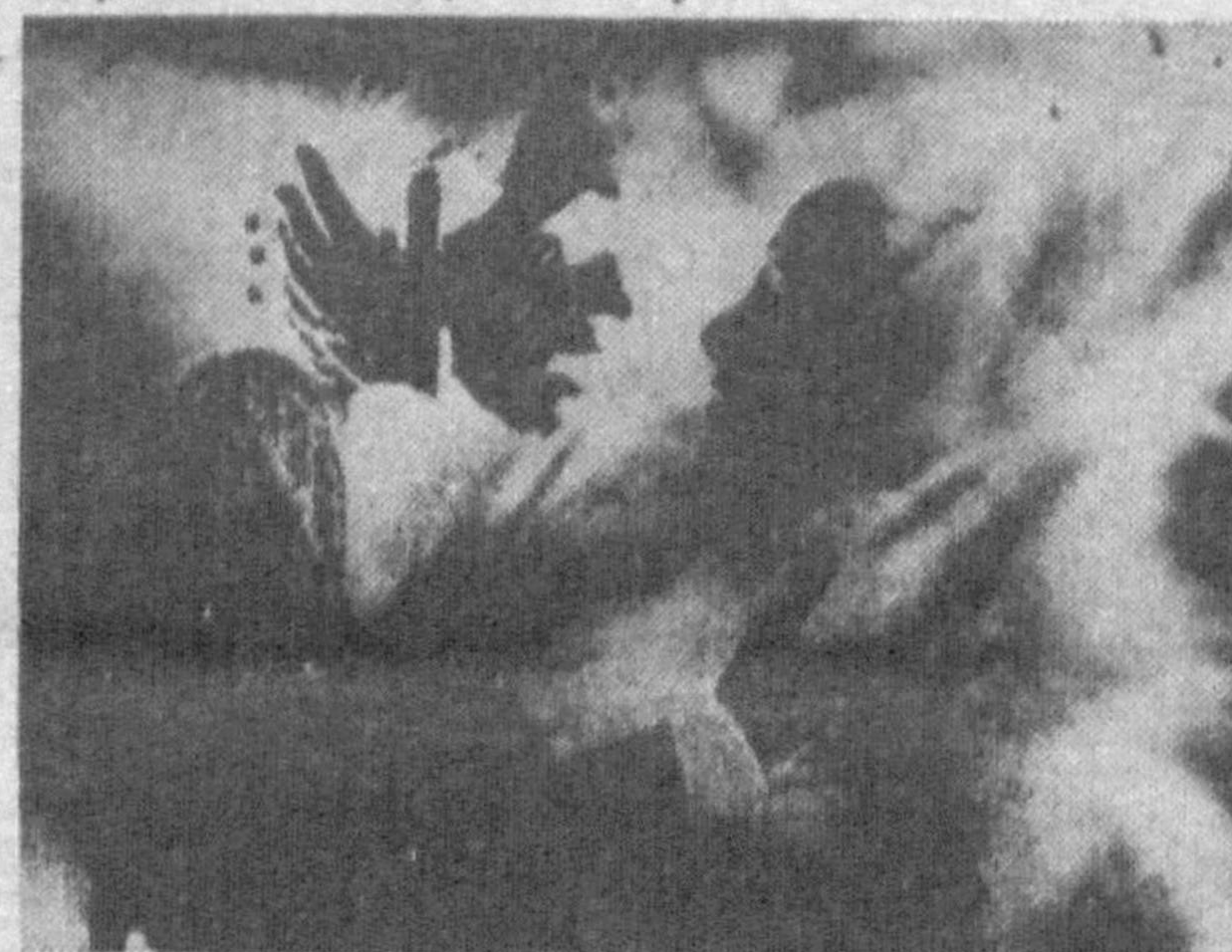
О. КУКАНБАЕВА. НА СНИМКАХ: фотографии, представленные на выставке.

Каждый образ, каждое движение, запечатленные фотокамерой, — это поистине прекрасные мгновения жизни на сцене, подсмотренные равнодушным глазом.