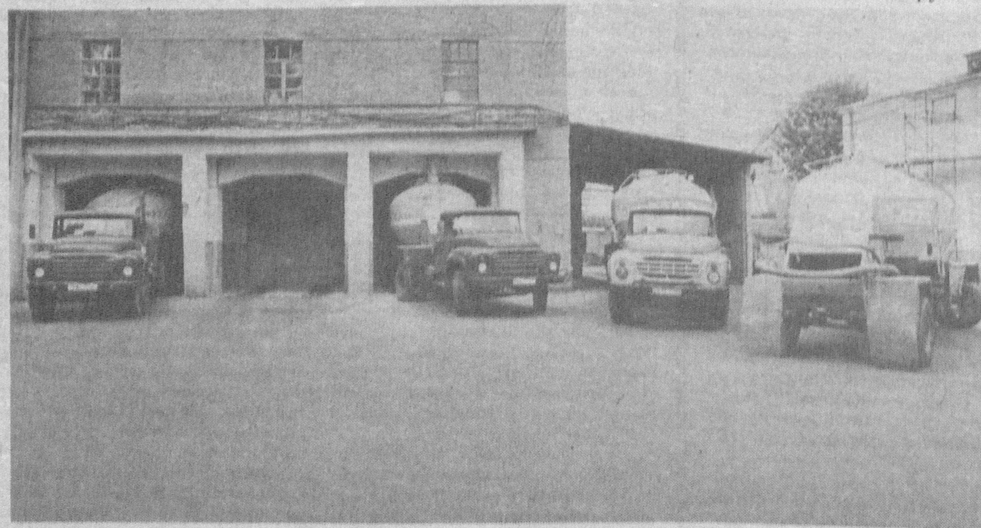
Отсюда отправляется мука к потребителям.

только за это время произведено 5330 тонн сверхплановой муки и крупы на 276 миллионов рублей, получено 300 миллионов рублей