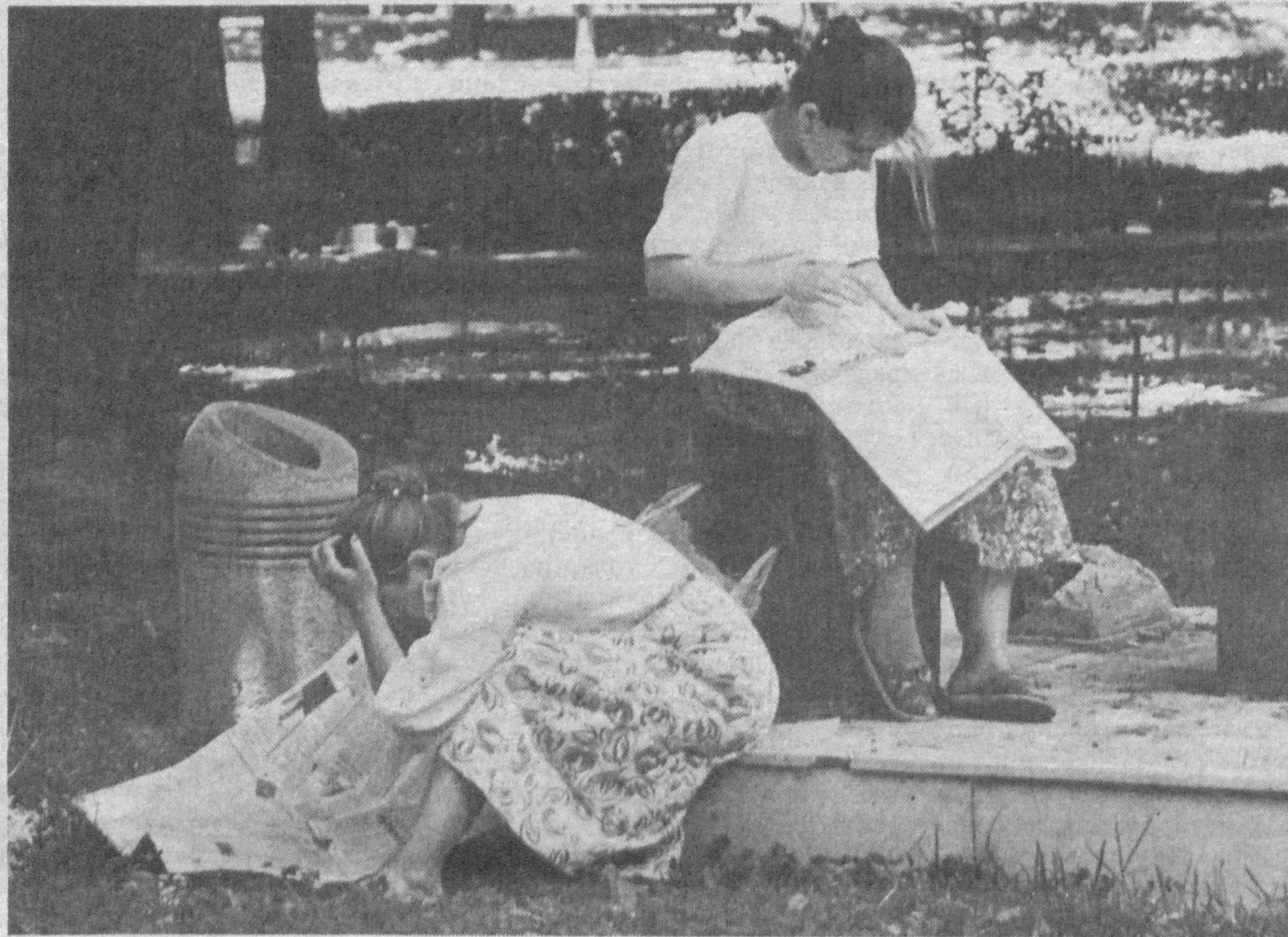
Что же так увлеченно, забыв про все на свете, читают эти девушки? Может, какую-нибудь

ПРИ ПРИГОТОВЛЕНИИ первых овощных блюд рекомендуется добавлять немного муки (2-3 г на порцию) для предохранения витамина С от разрушения.