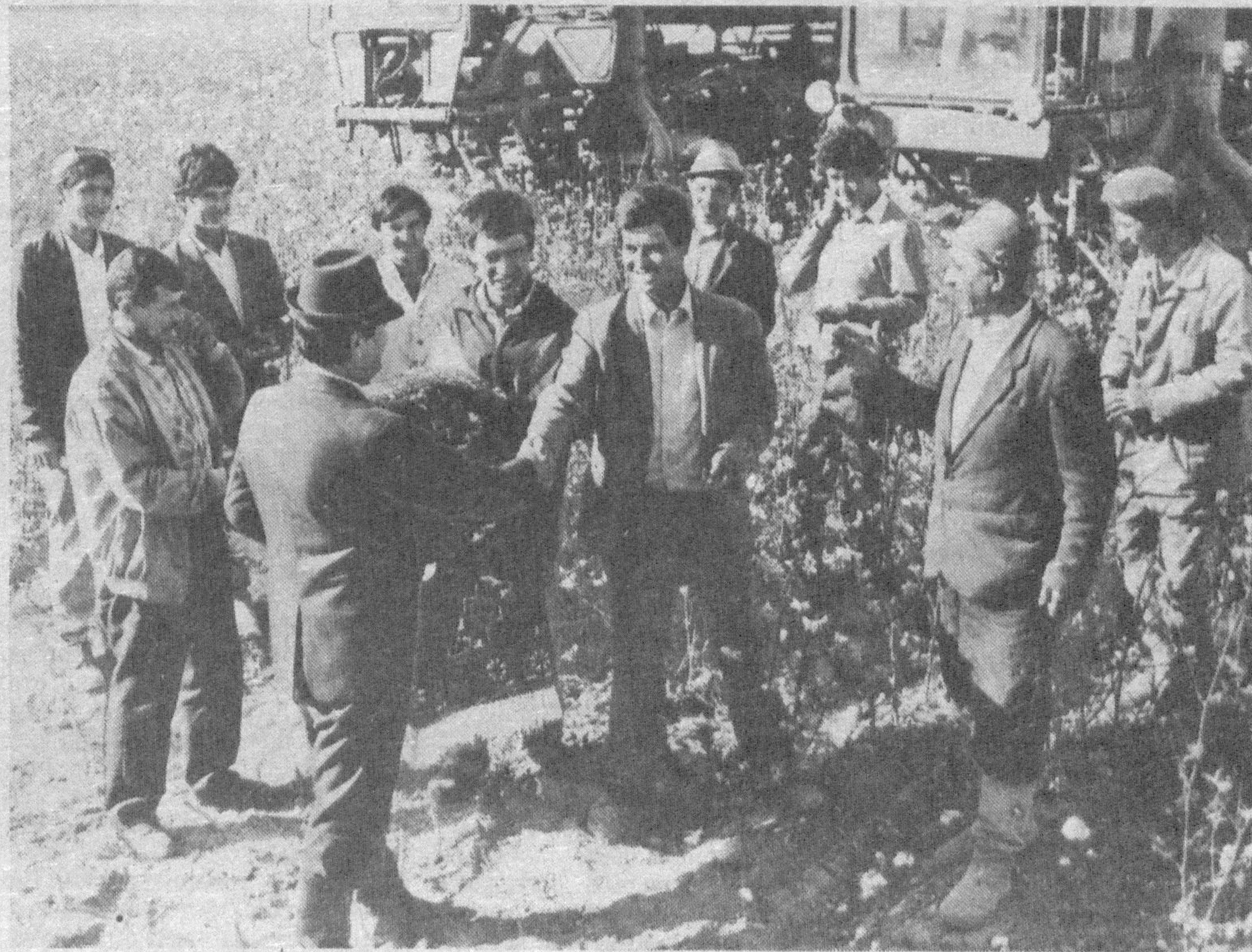
НА СНИМКЕ: радостно отмечают трудовую победу земледельцы колхоза "Каракум" Хивинского района.

Президент Республики Узбекистан Ислам КАРИМОВ.