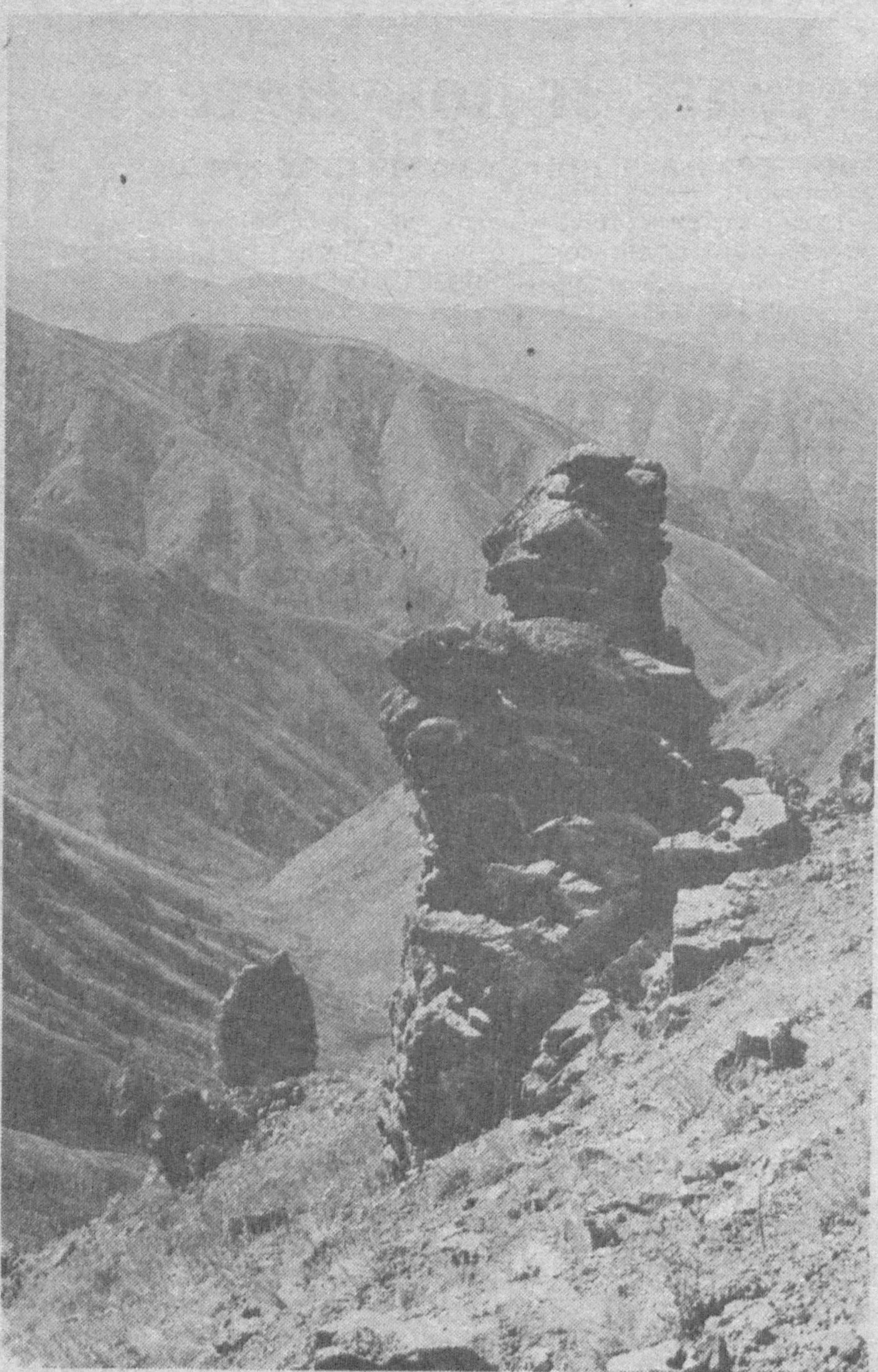
Осень в горах.

РАНЫ с трудом зарастающие. Лечатся травой живокости (окопник). Три его побега варятся в 1 литре воды, пока вода наполовину не испарится. Рана промывается процеженным раствором.