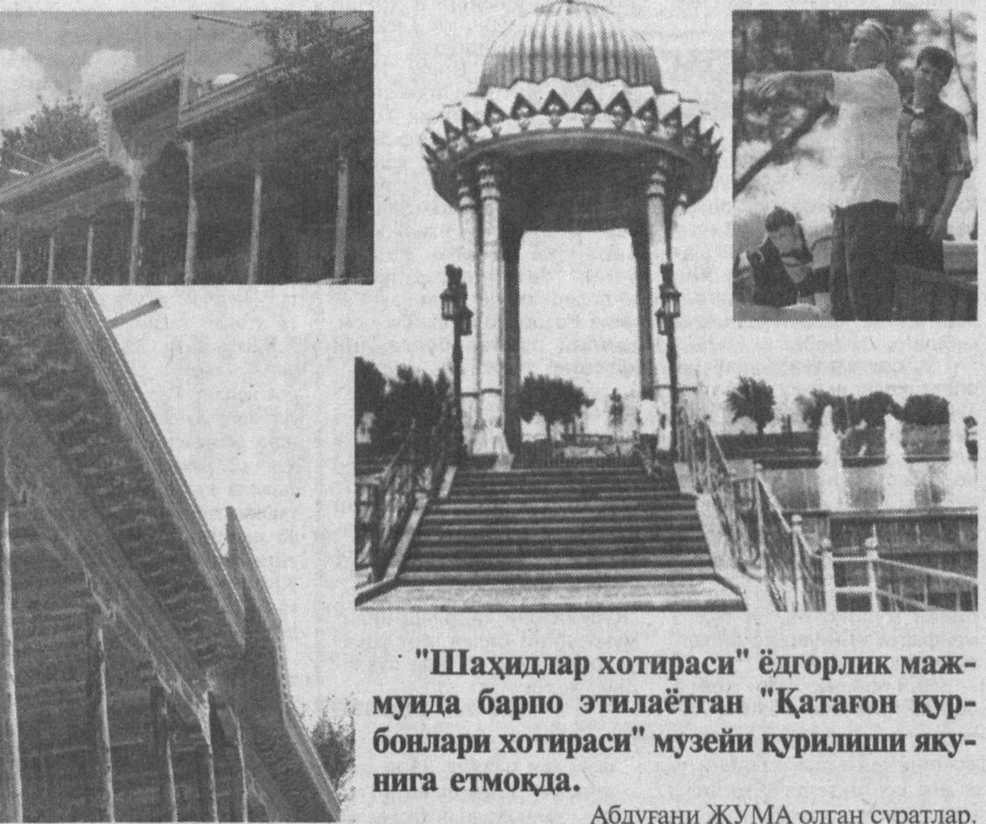
"Шаҳидлар хотираси" ёдгорлик мажмуида барпо этилаётган "Қатагон қурбонлари хотираси" музейи қурилиши якунига етмоқда.

Кўрғон тумани галлакорларининг 22 минг тоннадан галла тайёрлаб, ҳар қайси туман ўз шартномавий режаларини мамлакатимизда биринчилардан бўлиб баҳаргани ва яна режага қўшимча равишда минглаб тонна галла тайёрлашга азму қарор қилгани бу йилги ҳосил карвонининг салохияти гоёт катта эканлигини далolatларидир.