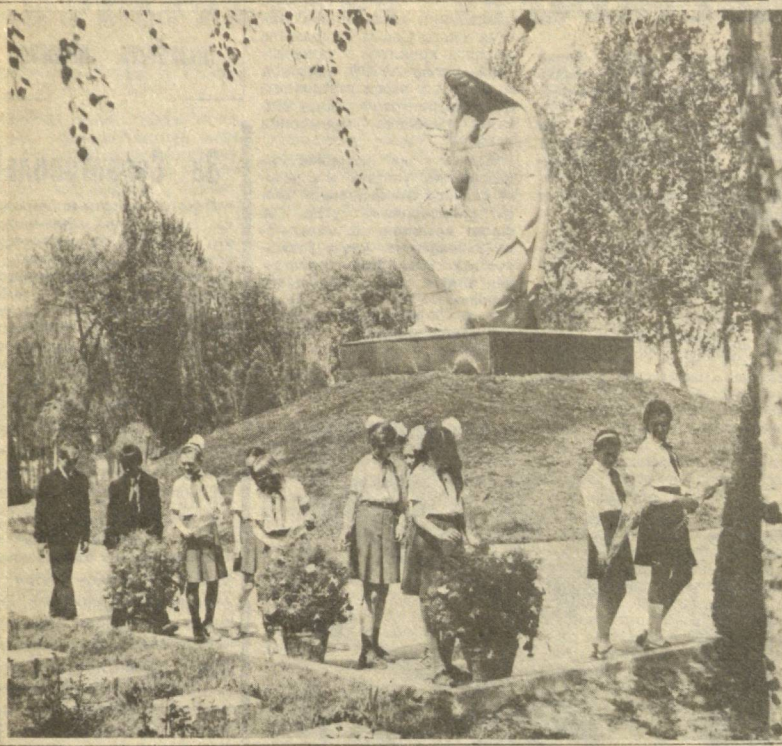
И правнуки тихо Проходят с цветами Вдоль стройного ряда Солдатских могил.