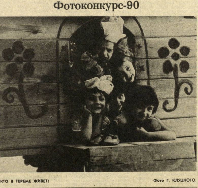
КТО В ТЕРМЕ ЖИВЕТ!

Н. ИСКАНДЕРОВА. Соб. корр. «Правды Востока».