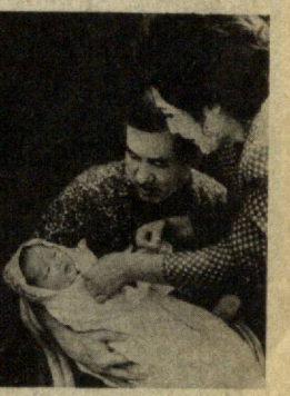
НА СНИМКЕ: Ро Дэ У с женой Ким Он Сун в кругу своей семейной резиденции.

Помимо своих непосредственных обязанностей Ро Дэ У много внимания уделяет политике в области спорта, председавательству в многочисленных спортивных обществах и комитетах. Свободное от общественной и политической деятельности время президент полностью отдает семье — жене, детям и внукам, увлекается теннисом и садоводством. На отдыхе любит читать корейскую литературу и слушать классическую музыку.