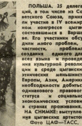
ПОЛЬША. 25 делегаций, в том числе из Советского Союза, приняли участие в IV всемирном конгрессе цыган, состоявшемся в Варшаве. Его участники обсудили много проблем, в частности, проблемы создания единого для всех языков и проведения культурной революции в среде цыганских этнических меньшинств Европы, Азии, Америки, необходимости добиться одинакового правового статуса и социально-экономических условий в странах проживания. НА ЦИМКЕ: выступление цыганских артистов.

Требуются жесткие меры. С 21 мая в сельском хозяйстве республики запрещено применение 16 наиболее токсичных ядохимикатов. Среди них — тиодан, который не раз становился причиной групповых отравлений со смертельным исходом, ряд других ядов. Запрещено также использование хлорофоса при выращивании пищевых культур и любых химических пестицидов в теплицах. Кроме того, в течение ближайших трех лет будет прекращено применение еще нескольких видов ядохимикатов, в их числе столь «модные» сегодня котран и фозалон. Без разрешения Минздрава не будут производиться и испытываться новые препараты. Прекращен отпуск пестицидов хозяйствам и предприятиям, которые не имеют специально оборудованных складов. Значит, надо поторопиться с внедрением биологических и других экологически чистых методов защиты растений.