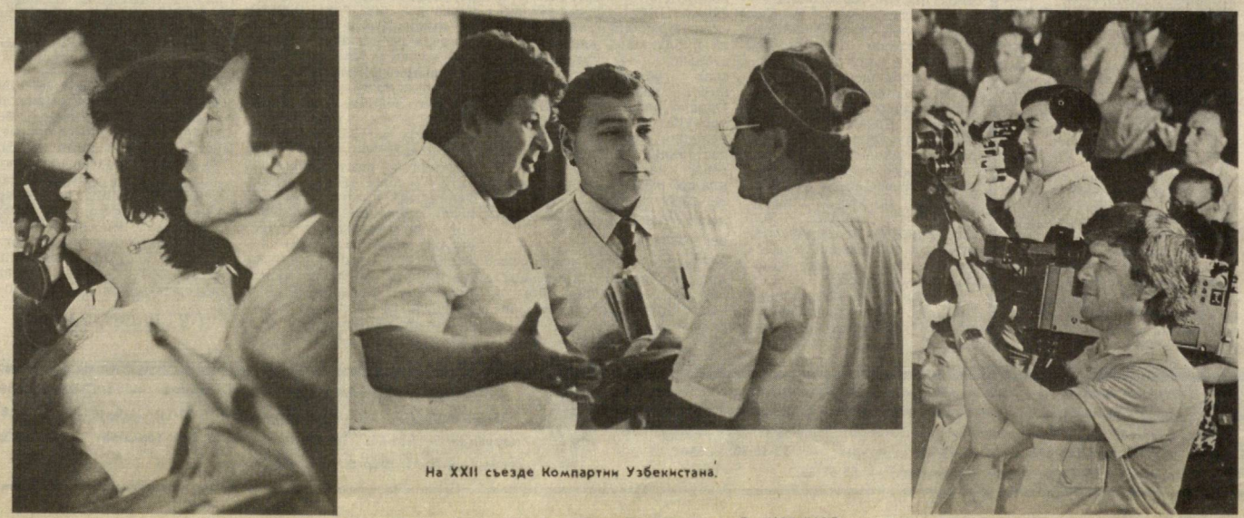
На XXII съезде Компартии Узбекистана.

Трудящиеся устали от митинговой демагогии. Сейчас важно поддержать действия ЦК Компартии Узбекистана и правительства республики, направленные на улучшение благосостояния народа. Имеются в виду наделение сельских труженников дополнительными присудаемыми участками, помощь малообеспеченным многодетным семьям, инвалидам и пенсионерам, бесплатные завтраки учащимся младших классов и т. д. Необходимо и дальше укреплять морально-психологический климат в обществе, возрождать исконно народные праздники, традиции, культурные ценности.