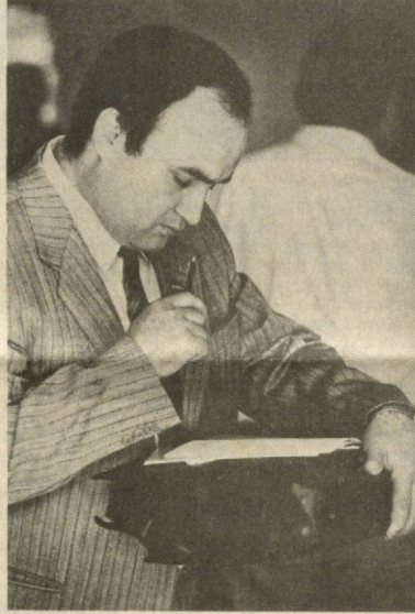
На XXII съезде Компартии Узбекистана.