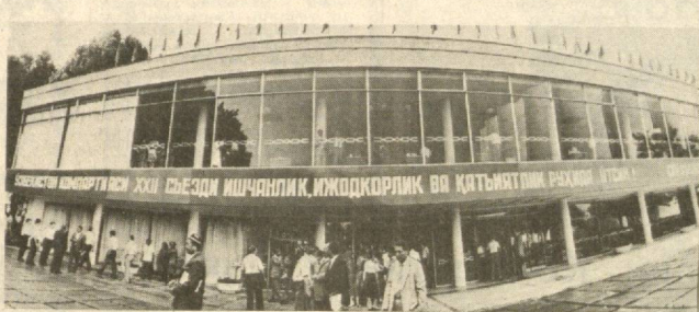
На XXII съезде Компартии Узбекистана.