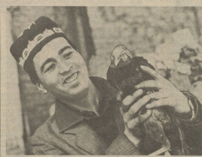
Год назад на территории Анджанской автоколонны № 2511 появился живой уголок. В просторных вольерах прижились воркующие голуби, важные павлины, кеклики и фазаны. Маленькое царство живой природы помогает отдохнуть

— Посетителям гатчинского ресторана «Меркурий» был предложен широкий выбор национальных блюд: плов, шашлык, лагман, шурпа, машхурда, чучуара, нори, самса, манты, горячие лепешки, фирменные салаты и многое другое. О том, насколько наша кухня была популярна, можно судить по тому, что ежедневный доход ресторана значительно увеличился. Часть нашей продукции реализовывалась в кулинарном магазине при