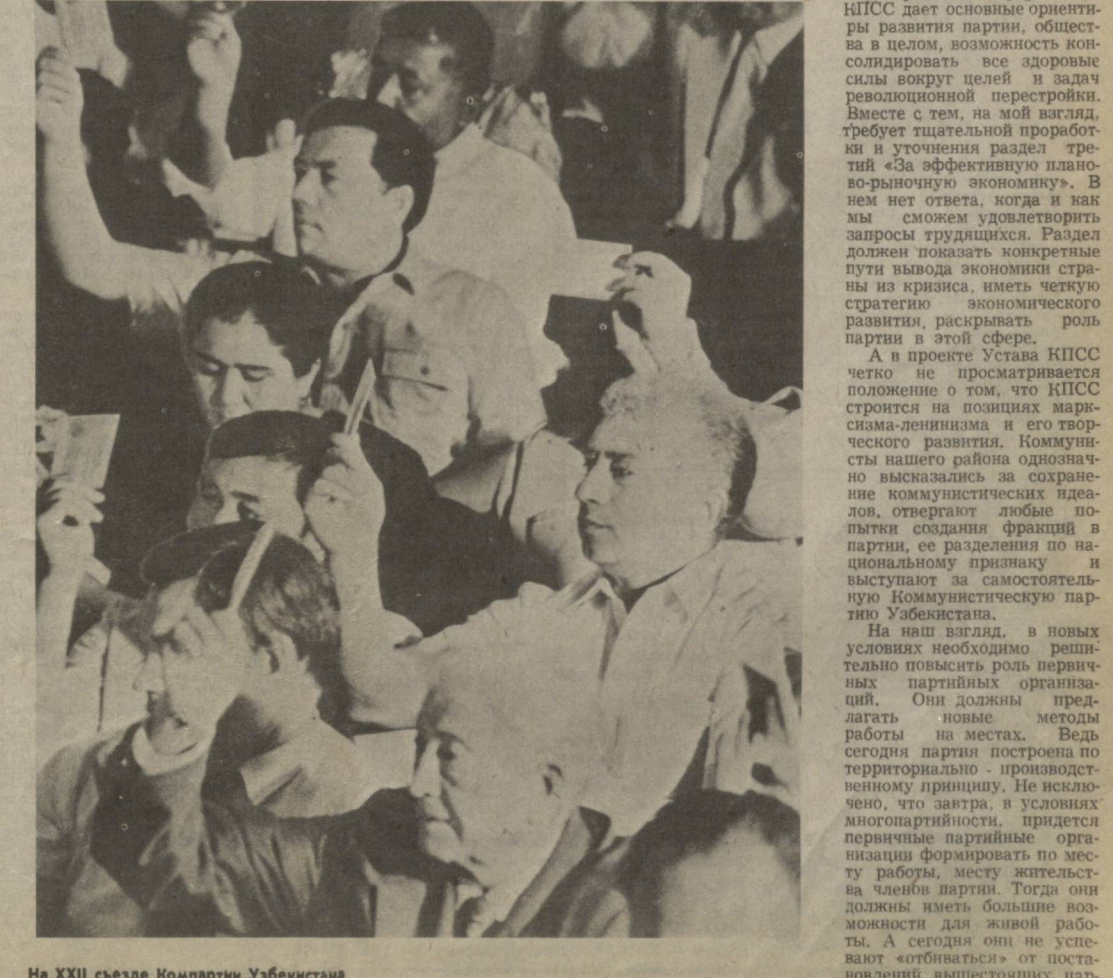
На XXII съезде Компартии Узбекистана.

и внимательно ознакомилась с тезисами Политического доклада XXII съезду Компартии Узбекистана, где особое внимание обращено на вопросы интернационального воспитания, подрастающего поколения. И действительно, уважение к человеку другой национальности надо воспитывать уже с дошкольного возраста.