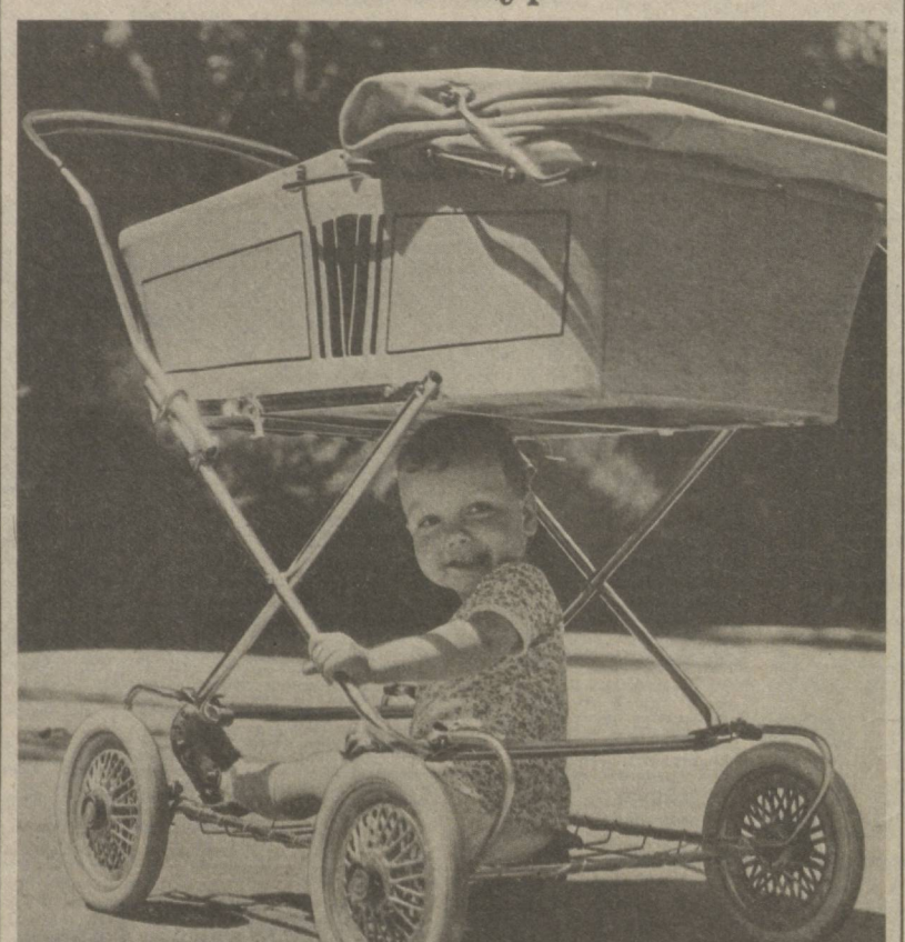
«Салон второго класса».