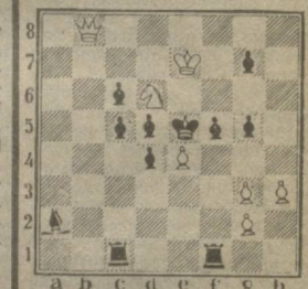
Мат в три хода