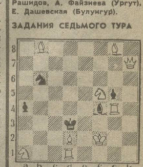
Мат в два хода