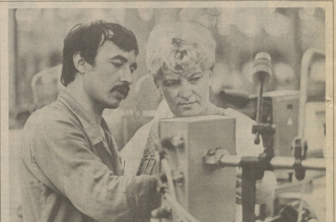
Коренная реконструкция проводится в Наманганском производственном шелковом объединении. Сейчас идет установка и обкатка современного оборудования отечественного и зарубежного производства в ткацком, прядильном цехах, отделочной фабрике. Предстоит освоить капиталовложений на 15 миллионов рублей. Это даст возможность уже в нынешнем году значительно увеличить выпуск и расширить ассортимент дефицитных тканей. С завершением реконструкции чистая прибыль предприятия составит 33 миллиона рублей. Во избежание возможных потерь в объединении и его

врачеванием, избавившись от бесконечного бумажного потока. Кроме работы статистической, «Нейрон» принимает непосредственное участие в лечении больного, например, производит расчет