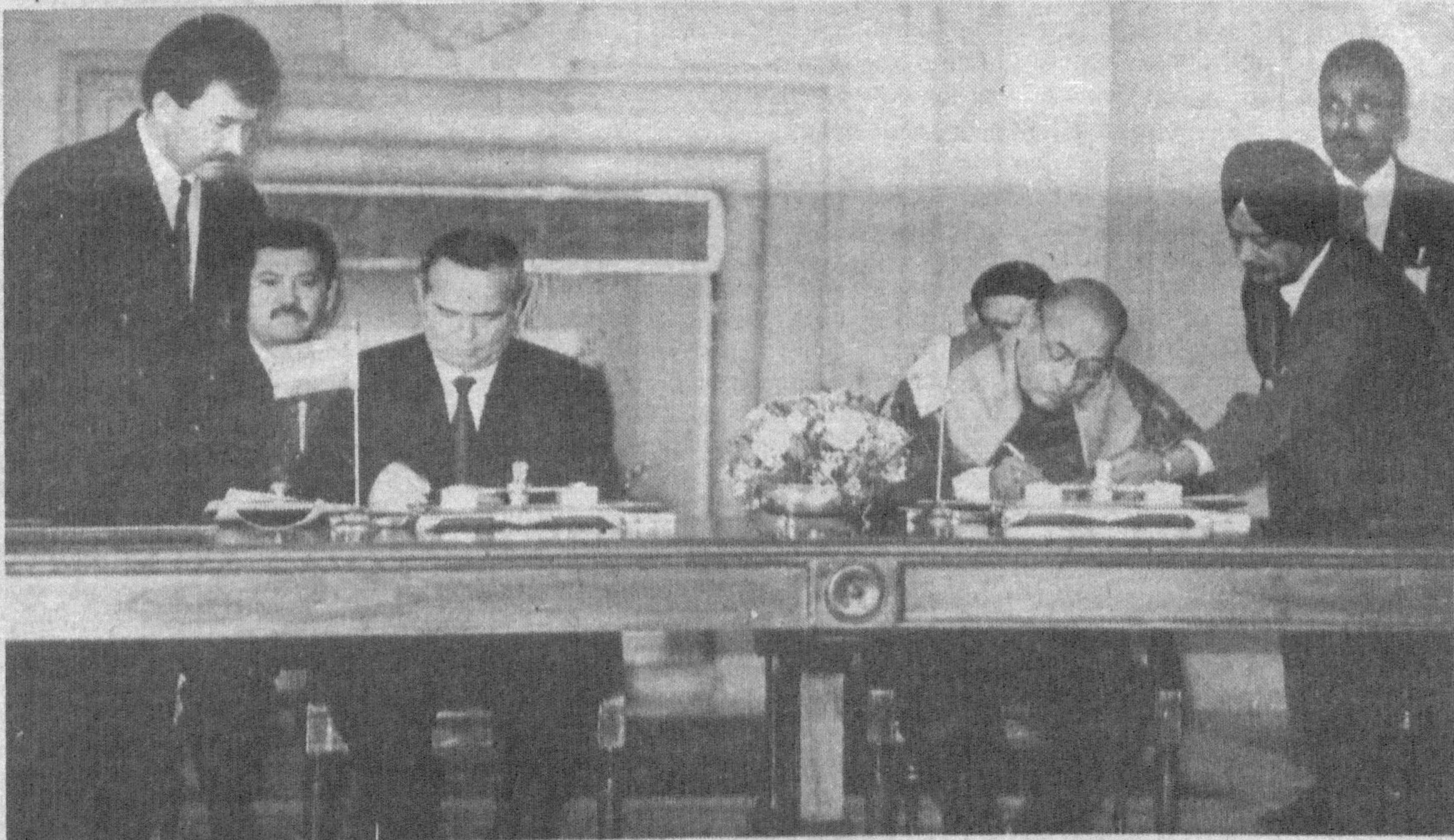
Во время подписания документов.