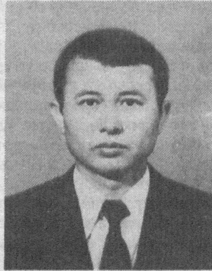
Первый секретарь Самаркандского областного совета НДП Узбекистана.

Родился в 1952 году в кишлаке Кайирма Паётдаргомского района. Трудовую деятельность начал в 1973 году корреспондентом самаркандской районной газеты "Шарк тонги". Работал юристом отдела капитального строительства облисполкома, инспектором облуправления народного образования, заведующим общим отделом облисполкома, зав. орготделом областного Совета народных депутатов.