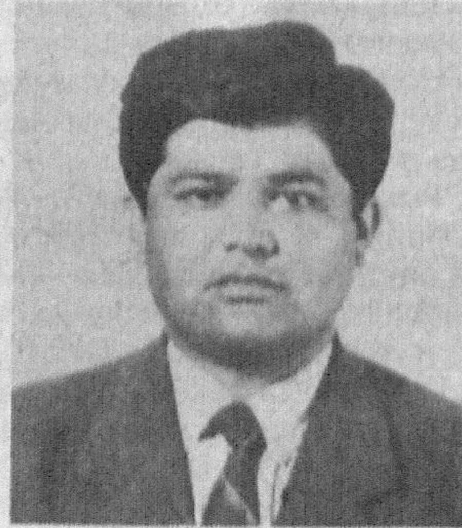
Второй секретарь Самаркандского областного совета НДП Узбекистана.

Родился в 1959 году в кишлаке Ишчан Ургутского района. Трудовую деятельность начал в колхозе имени Ахунбабаева Ургутского района. По окончании Самаркандского госуниверситета в 1983 году работал инженером районного информационно-счетного центра, затем заведующим отделом, а с 1992 года — первым секретарем областного комитета Союза молодежи Узбекистана. На общественных началах был заместителем хокима области по молодежной политике.