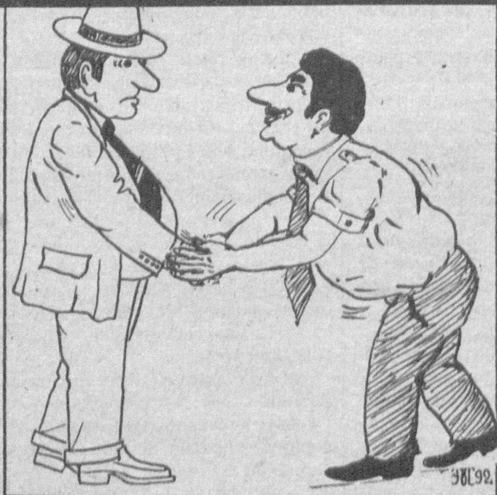
Рис. М. ЭШОНКУЛОВА.