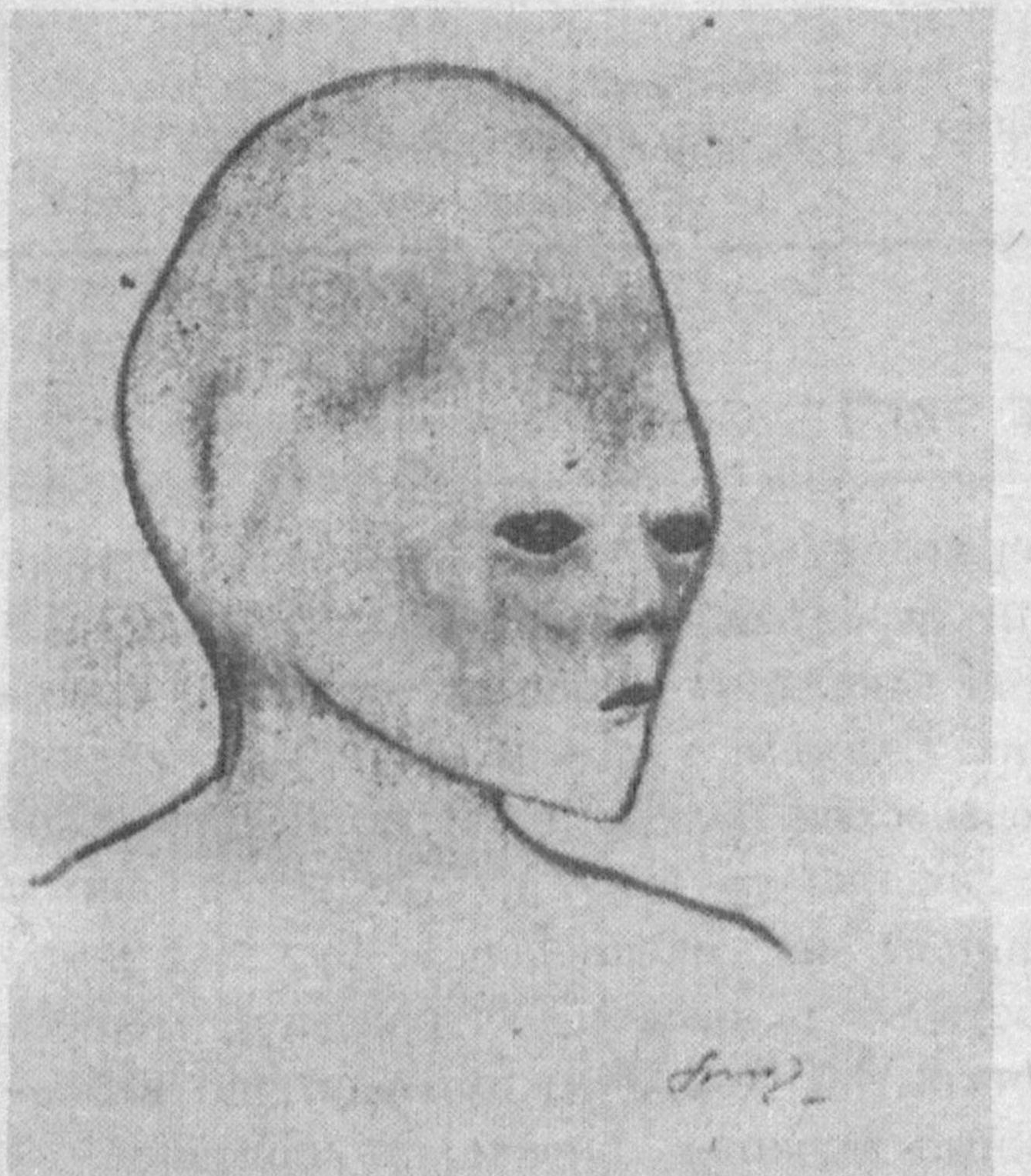
Рисунок с фотографий, опубликованных газетой «Нешил инкуайер». По сообщению газеты этот гуманоид был пойман агентами ЦРУ в 70 ярдах от места посадки НЛО в горах на западе Вирджинии 29 сентября 1990 года. Рост гуманоида порядка 180—190 см.

Гуманоид с черным цветом кожи. Глаза светятся зеленым светом. Одевание — белый балахон до земли. Наблюдался в 1970 году в 2 часа ночи в начале января около деревни Зяболотье Смоленской области. Пытался открыть дверцу кабины двигавшегося трактора.