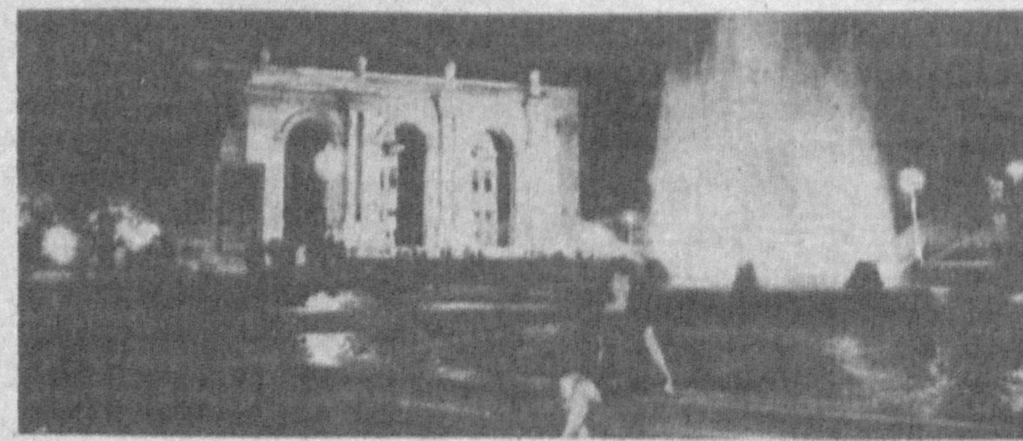
НА СНИМКЕ: ночной Ташкент.