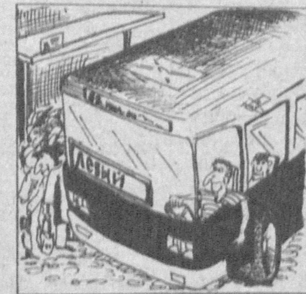
Рис. Ю. Бурмасова.