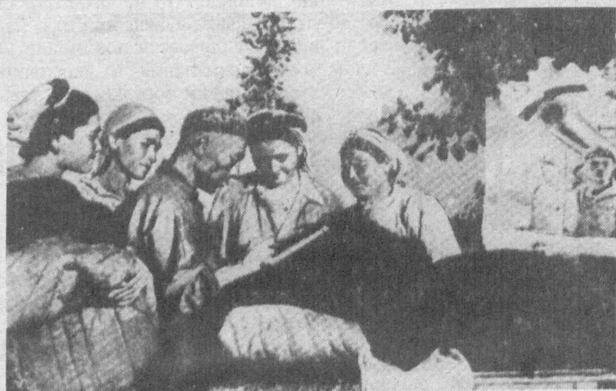
Отправка на фронт теплых вещей колхозниками сельхозартели им. Ахунбабаева Карасуйского района Ташкентской области.

15 ДЕКАБРЯ. Колхозы и совхозы Узбекистана выполнили план хлопкозаготовок. Государству сдано 1657,2 тысячи тонн хлопка-сырца, на 200 тысяч тонн больше, чем в 1940 году.