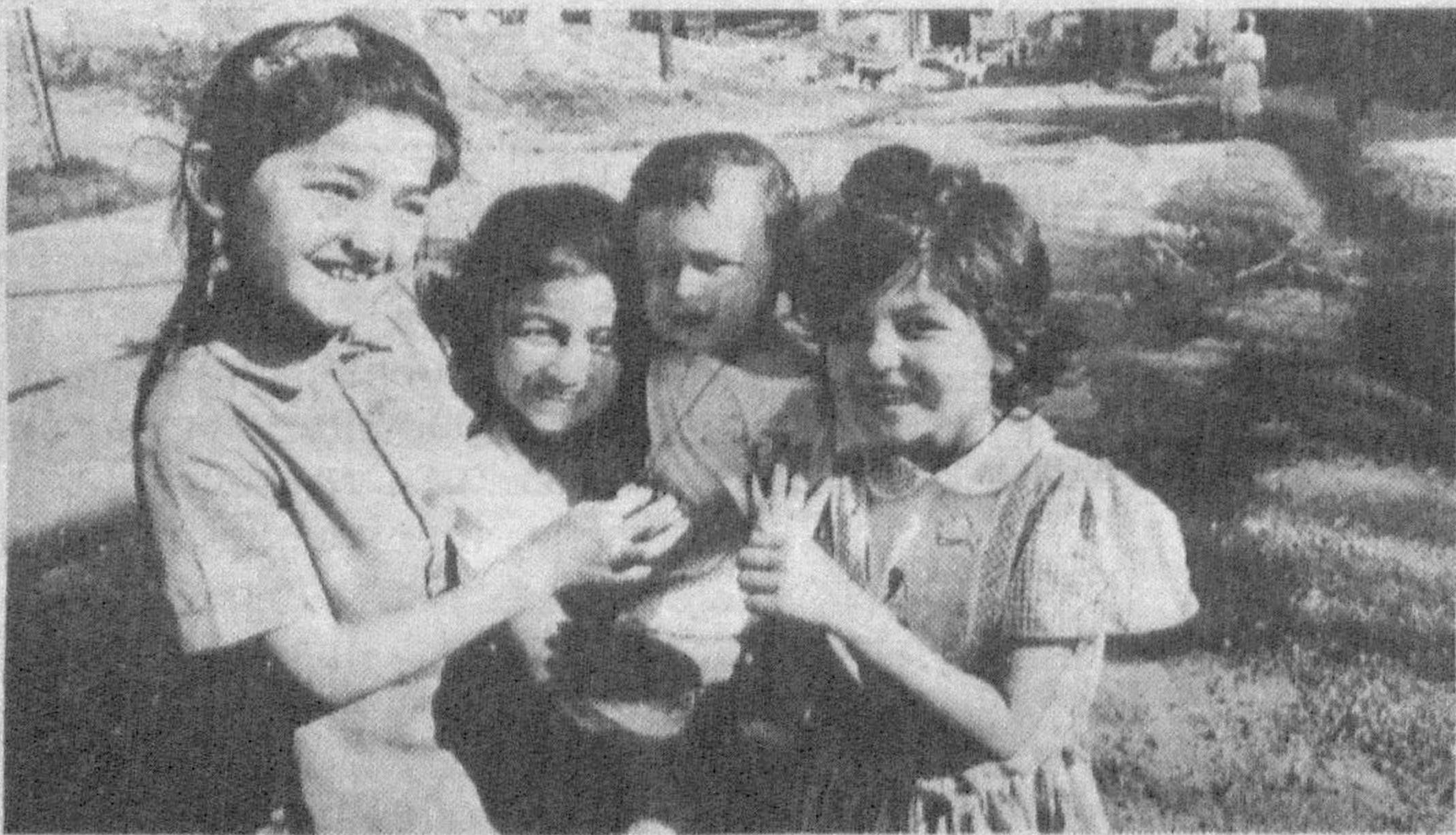
НА СНИМКЕ: подруги.

Я.УМАНСКИЙ, доктор педагогических наук, научный консультант отдела парламентской работы и межпарламентских связей ЦС НДП Узбекистана.