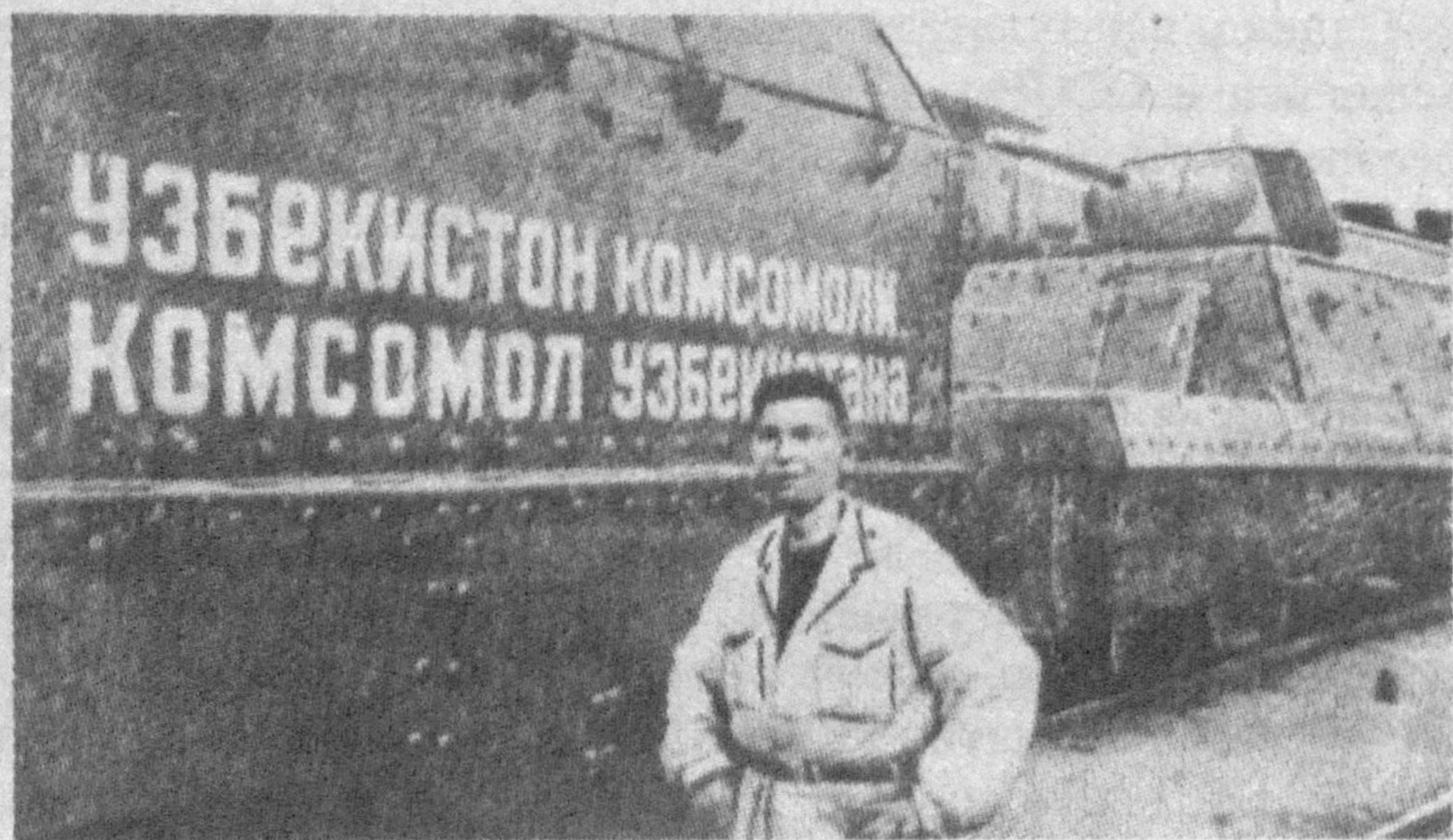
НА СНИМКЕ: бронепоезд "Комсомол Узбекистана", построенный на средства трудящихся республики.

С этого месяца начали выплачиваться стипендии нуждающимся студентам, демобилизованным из рядов Красной Армии и Военно-Морского Флота по ранению или болезни.