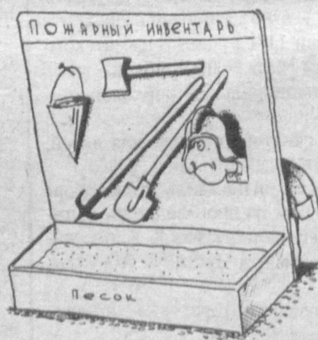
Рис. Ю. Бурмасова