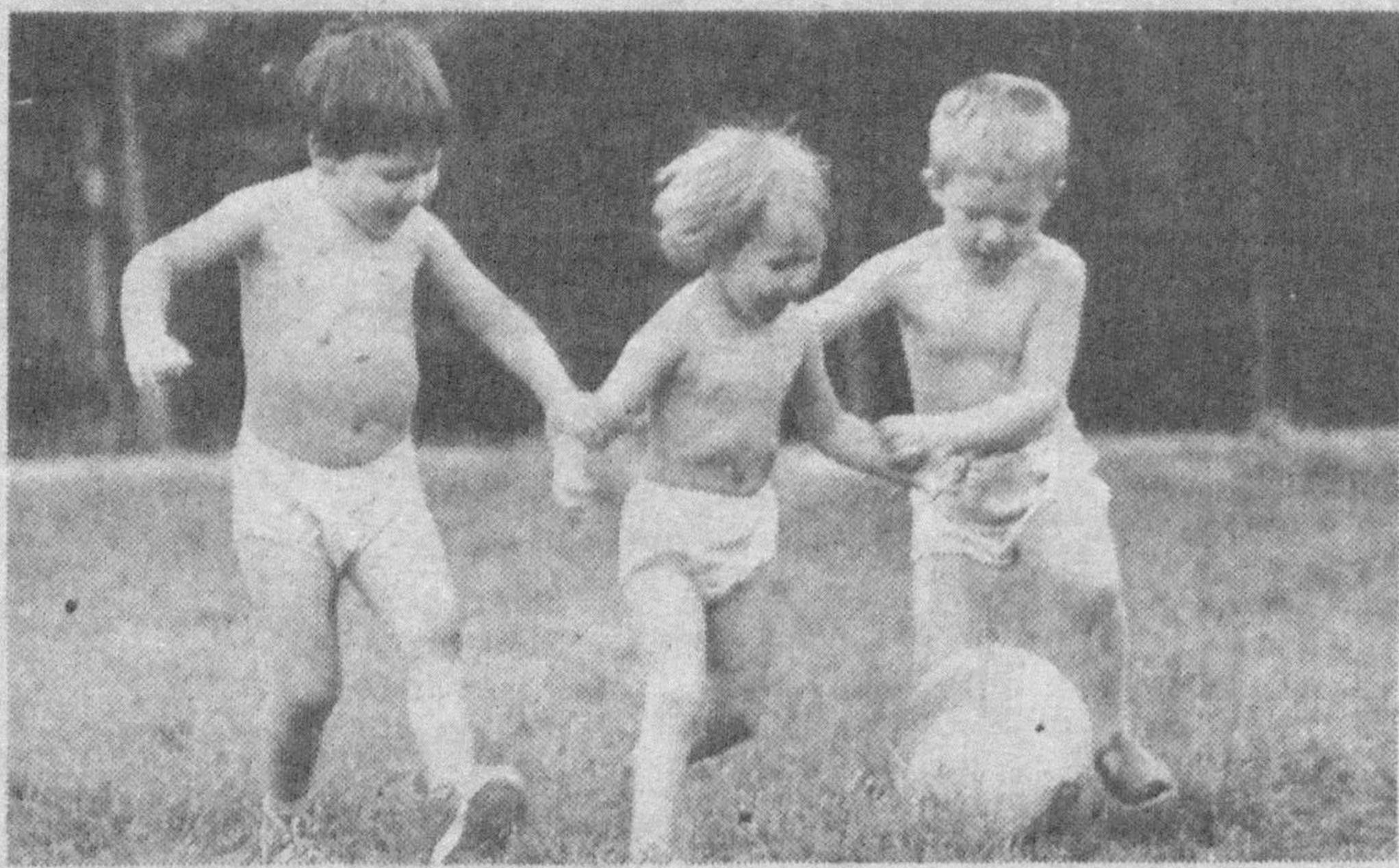
Счастливые детство. Фотоэтиюд Р. ЗАГРАТДИНОВА.

Простор широк, преград отныне нет — Шагай дорогой счастья и побед! Дум светлых и свершений караван — Велик твой новый день, Узбекистан! Перевел с узбекского Раим ФАРХАДИ.