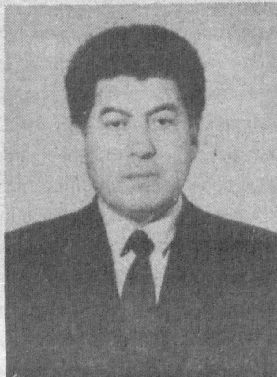
Родился в 1947 году. Из кишлака Бирлашган Янгикурганского района Наманганской области. Узбек. Окончил Ташкентский государственный

Политисполком Центрального Совета Народно-демократической партии Узбекистана.