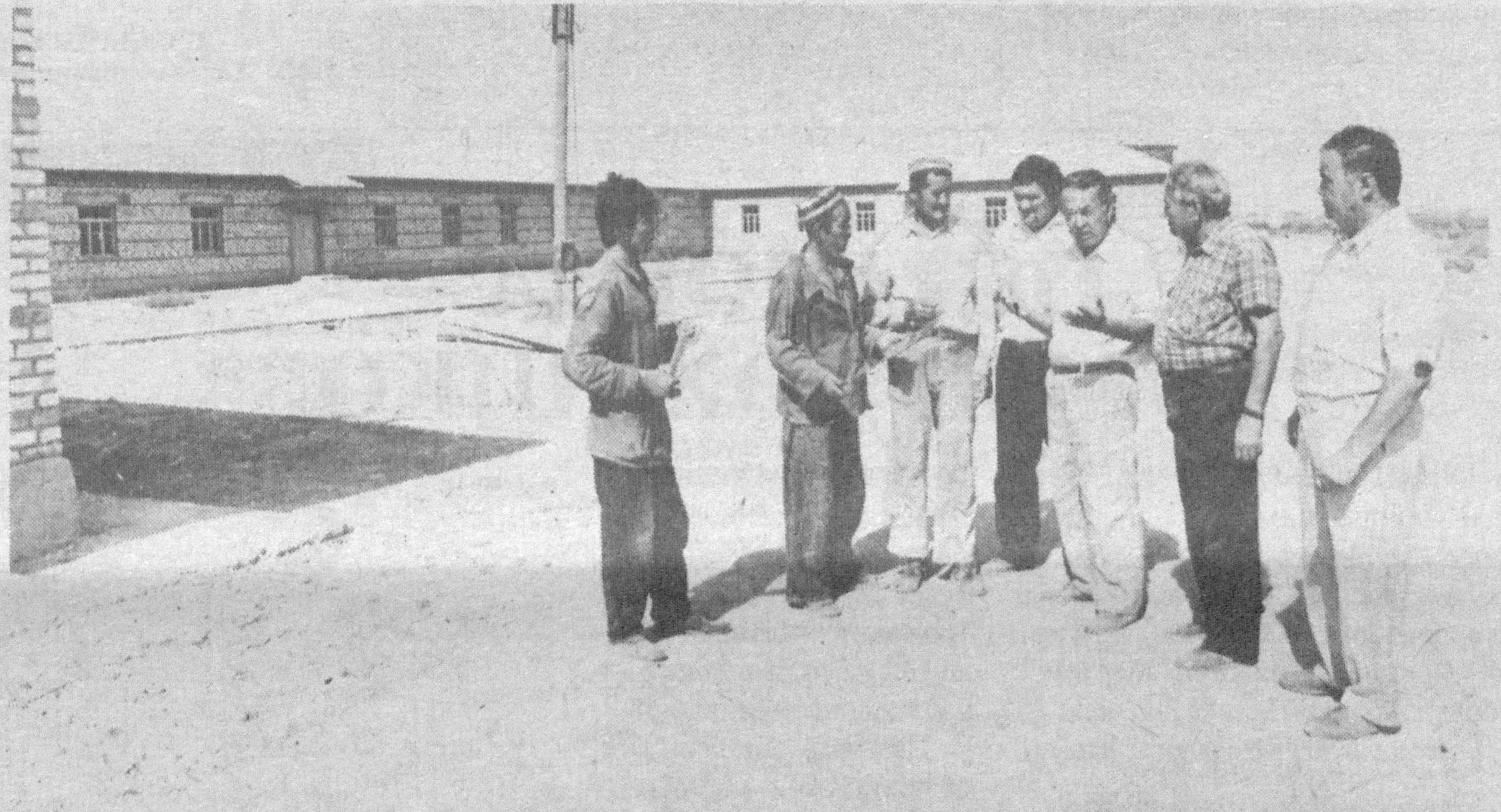
Материалы разворота подготовили Рафаэль Загратдинов и Марат Балтабаев (фото).

На снимках (внизу): довольны детским садом «Бойчек» и дети, и родители.