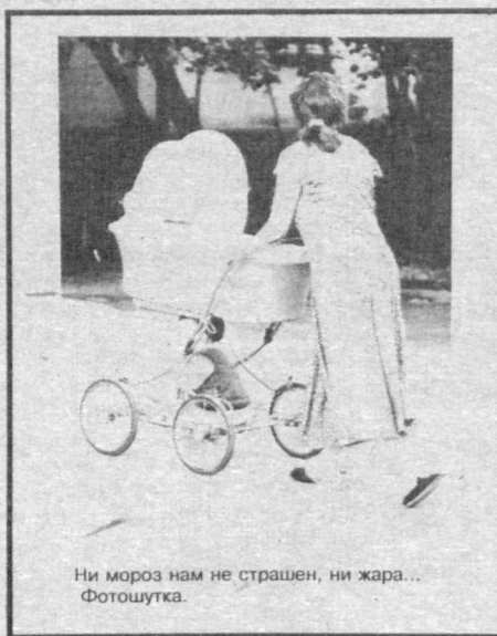
Ни мороз нам не страшен, ни жара... Фотошутка.