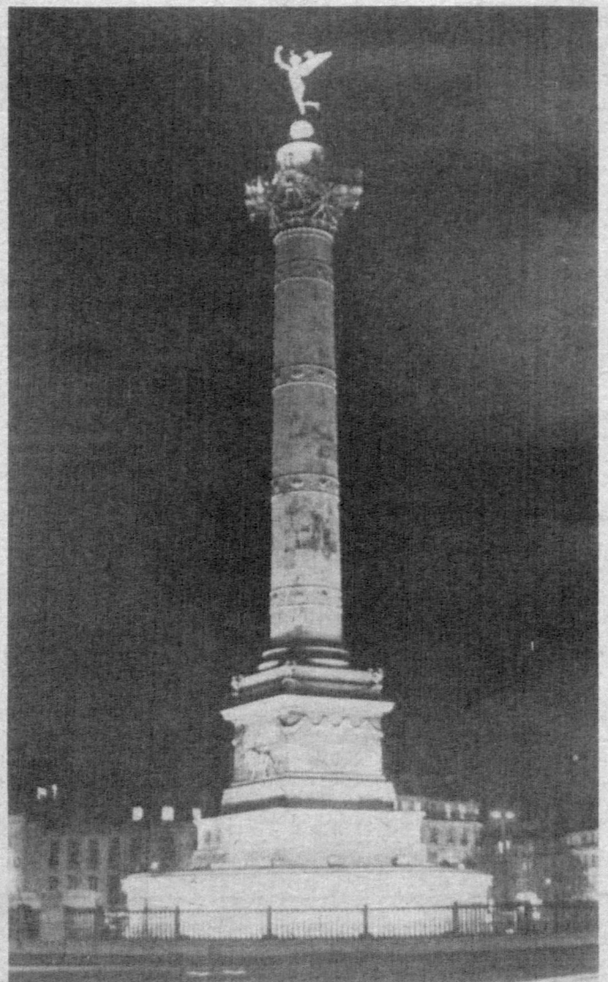
НА СНИМКЕ: статуя Свободы на площади Бастилии в Париже.