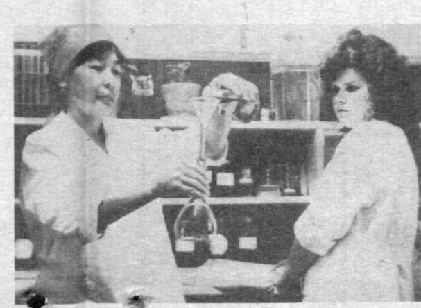
В лаборатории специализированной инспекции аналитического контроля за качеством промышленных стоков и состоянием водоемов.

Как и в любом деле, здесь неоценима роль гласности. Поэтому о промежуточных результатах конкурса постоянно идет речь на планерках у руководства, собраниях коллективов, на страницах многотиражной газеты «Металлург».