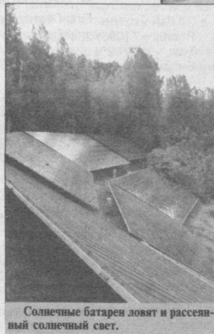
Солнечные батареи ловят и рассеивают солнечный свет.