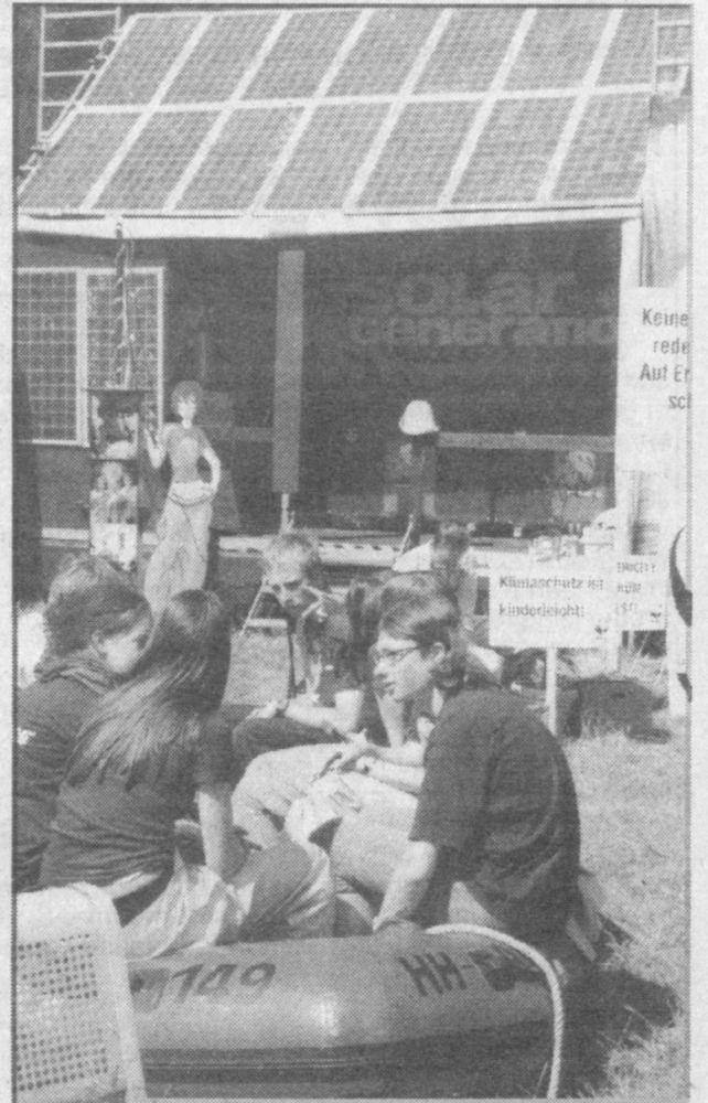
В течение всей Боннской конференции молодежь заявляла, что не хочет ходить с мокрыми ногами.

В лабораториях Дуисбурга журналистская братия много смеялась. В основном над собой. В разных вариациях мы