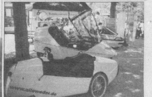
Электромобили не требуют добычи нефти.

задавали принимавшим нас ученым один и тот же вопрос про топливные ячейки. А ведь сначала они прочитали о новаторской идее лекцию, роздали брошюры и показали опытные модели. Видом модели напоминают бытовые масляные обогреватели, разве что пошире и в комплекте с компактным баллоном. Но электроэнергия, чтобы вырабатывать тепло и свет, им не нужна. Сами ее вырабатывают благодаря топливным ячейкам. В очередной раз звучит вопрос под хохот коллег «про ячейки», ученые обещают, что сейчас мы все сами поймем, и продолжают водить по лабораториям.