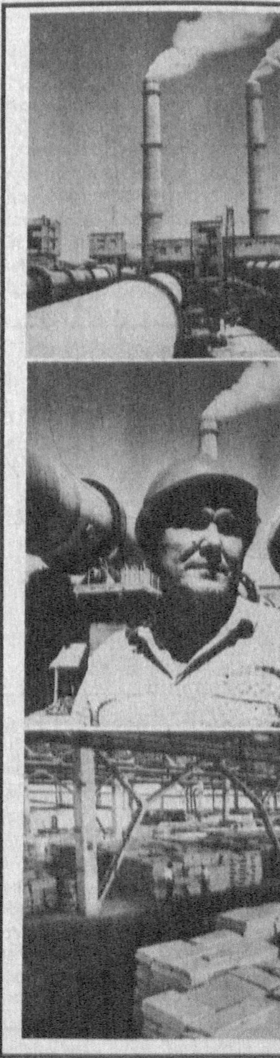
(«Правда Востока» за 19 сентября с.г.)