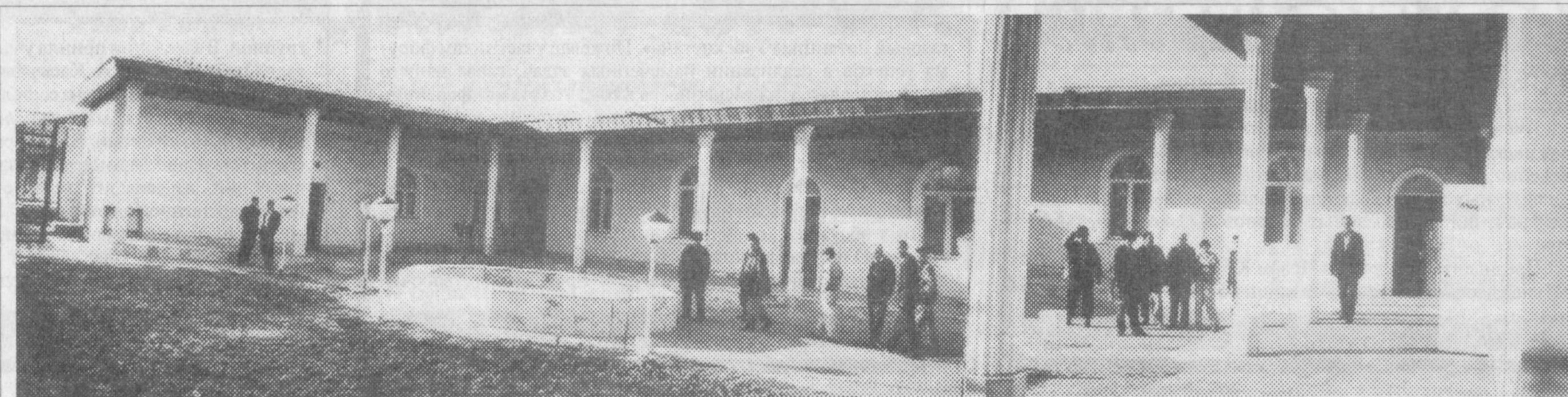
На снимке: новый гузар — комплекс объектов обслуживания населения, построенный и сданный в эксплуатацию в махалле «Ипакчи» в старогородской части Ташкента.

Занялся Икрам АХМЕТОВ, корр. «Голоса Узбекистана».