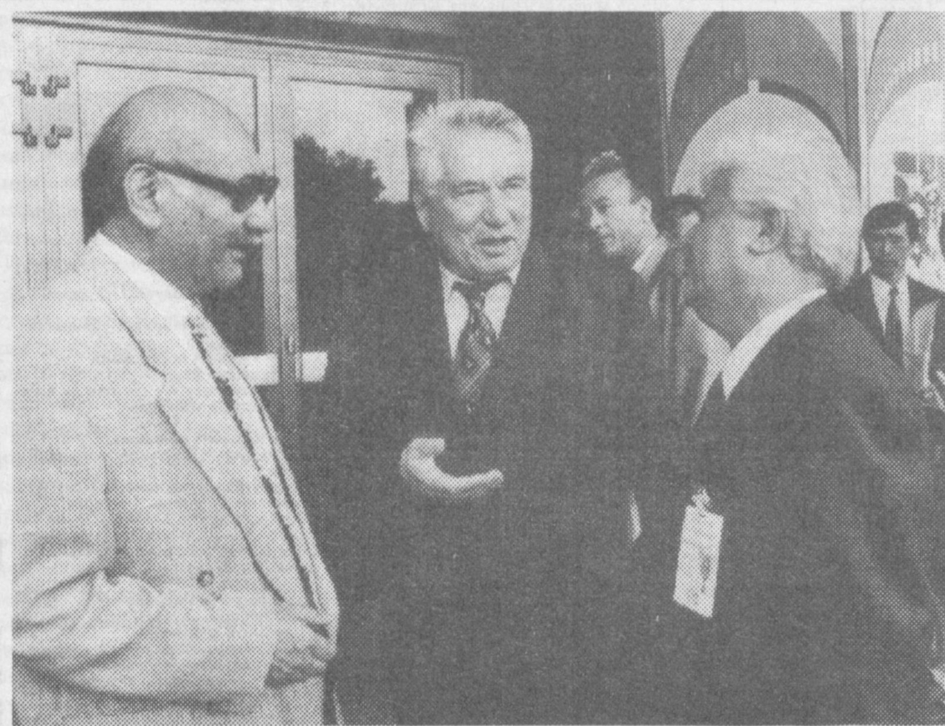
НА СНИМКЕ: гости XII Ташкентского кинофестиваля.

и грезы, и слезы, и песни. Они восклицают: о, Жизнь, цветы, торжествуй, не исчезни! А город в просторе земном — многоцветная лента. Сюда посмотри, астроном, Увидишь ты звезды Ташкента.