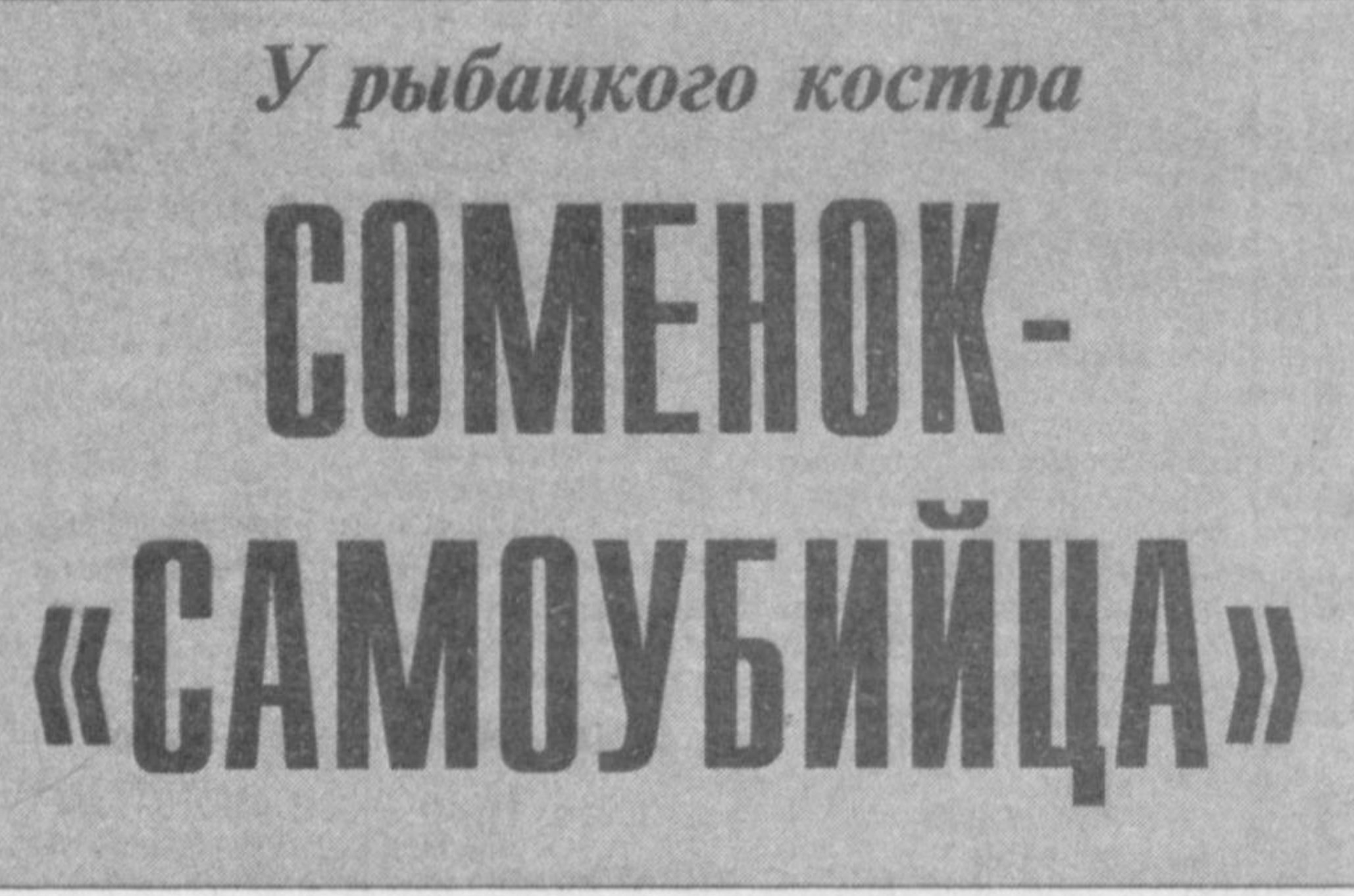
У рыбацкого костра СОМЕНОК-«САМОУБИЙЦА»

Недаром об этой ухе — прошло уже столько лет! — друзья нет-нет, да и вспоминают с улыбкой. И согревают их эти воспоминания, как яркие всполохи у рыбацкого костра в стильный осенний день.