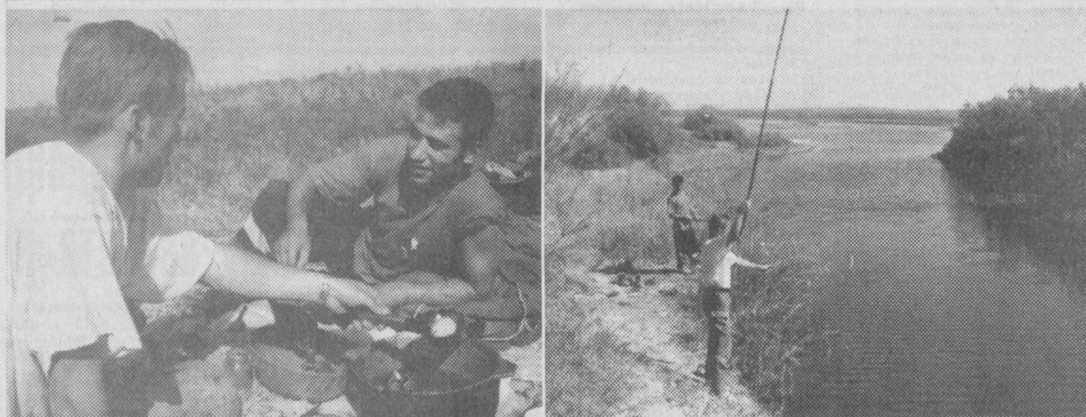
Хороша узбекская осень, когда уже нет изнуряющей летней жары, когда воздух чист и свеж, а солнце, сменив гнев на милость, не печет, а лишь слегка пригревает. И как приятно в такой осенний денек выбраться на природу, да если еще и с удочкой, а в охотничий сезон — и с ружьем...