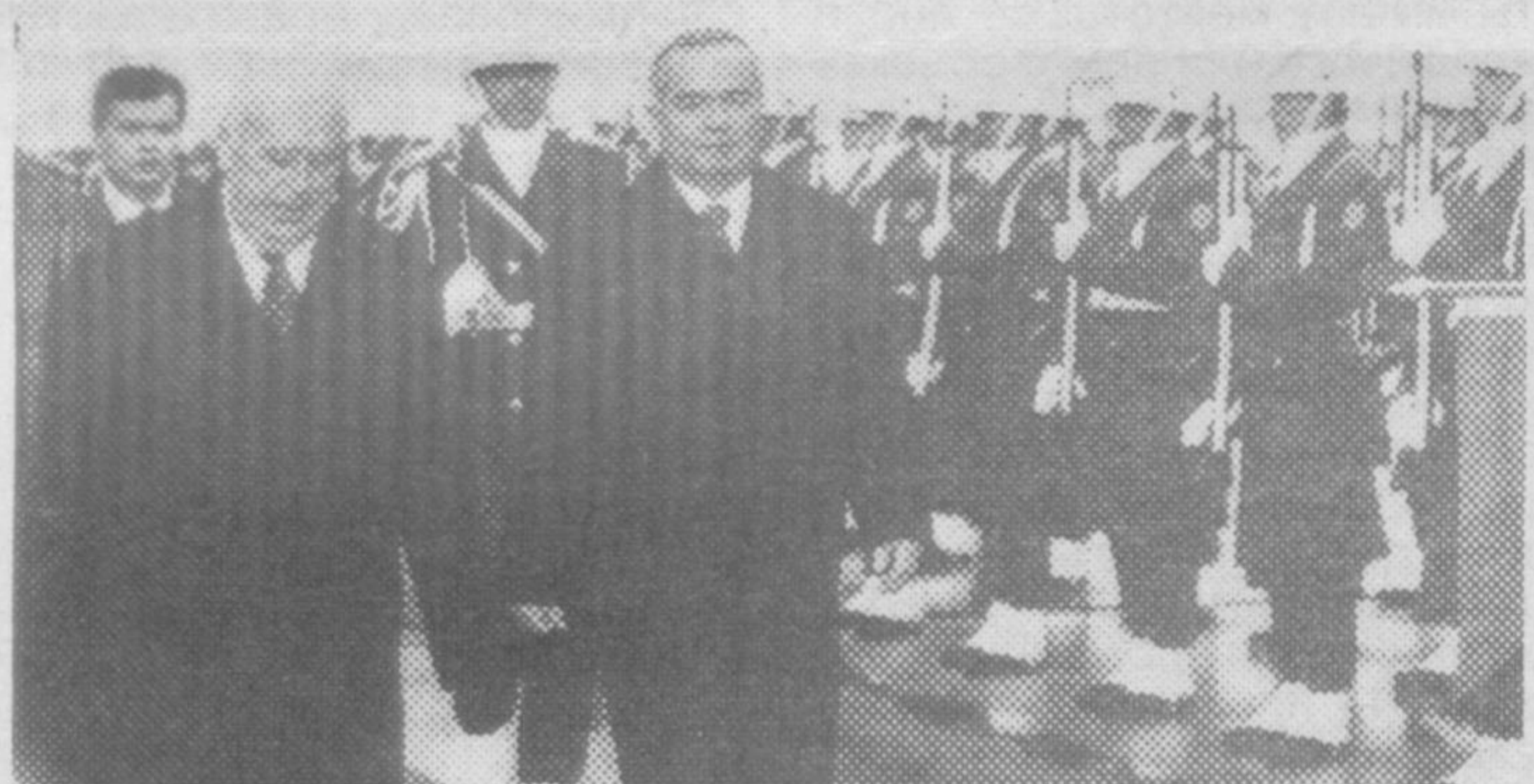
Официальный визит Президента Республики Узбекистан Ислама Каримова в Турцию. Президент Республики Узбекистан Ислам Каримов встречает Президента Турецкой Республики Сулеймана Демиреля.

Во второй половине дня предусмотрены встречи Ислама Каримова с председателем Великого Национального Собрания Турции Хикматом Четинем, премьер-министром Месудом Йылмазом, а также руководителями «Кочхолдинга» и Турецкого делового банка.