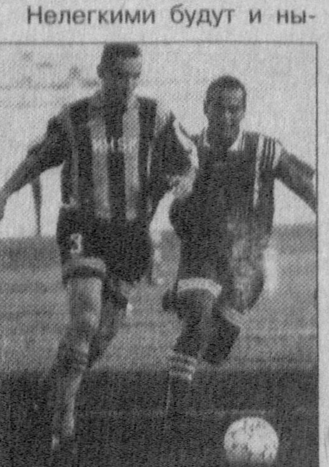
Нелегкими будут и нынче соревнования. В первых, ташкентские армейцы попали в сильную группу. Их соперниками станут киевское «Динамо», таллинская «Флора» и бакинский «Нефтчи».

Турнир с первых же лет своего существования стал популярным. В этом году он обещает быть особенно интересным. Болельщики с нетерпением ждут встречи неоднократного обладателя Кубка Содружества московского «Спартака» и возмутителя спокойствия в футбольной Европе киевского «Динамо».