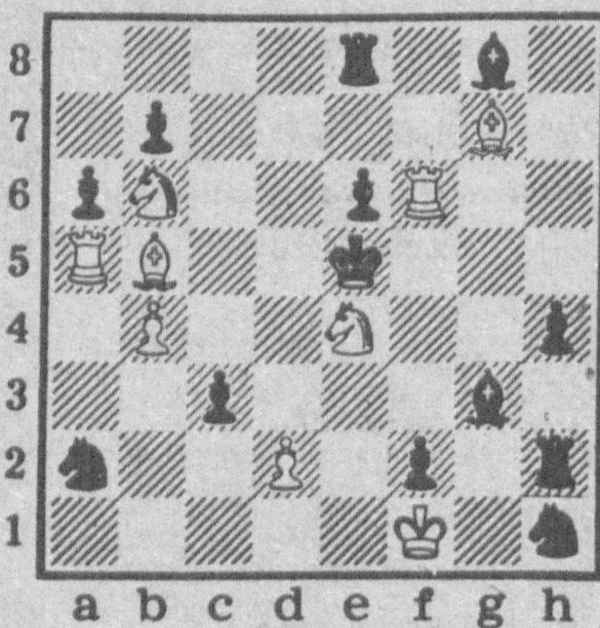
Мат в три хода

Если у вас в огороде на почве образуется корка, сейте вместе с морковью салат, редис или бираго (огуречную траву), размещая их семена в рядке через 25—30 см. Они взойдут намного раньше моркови, обозначат рядки и позволят провести рыхление почвы.