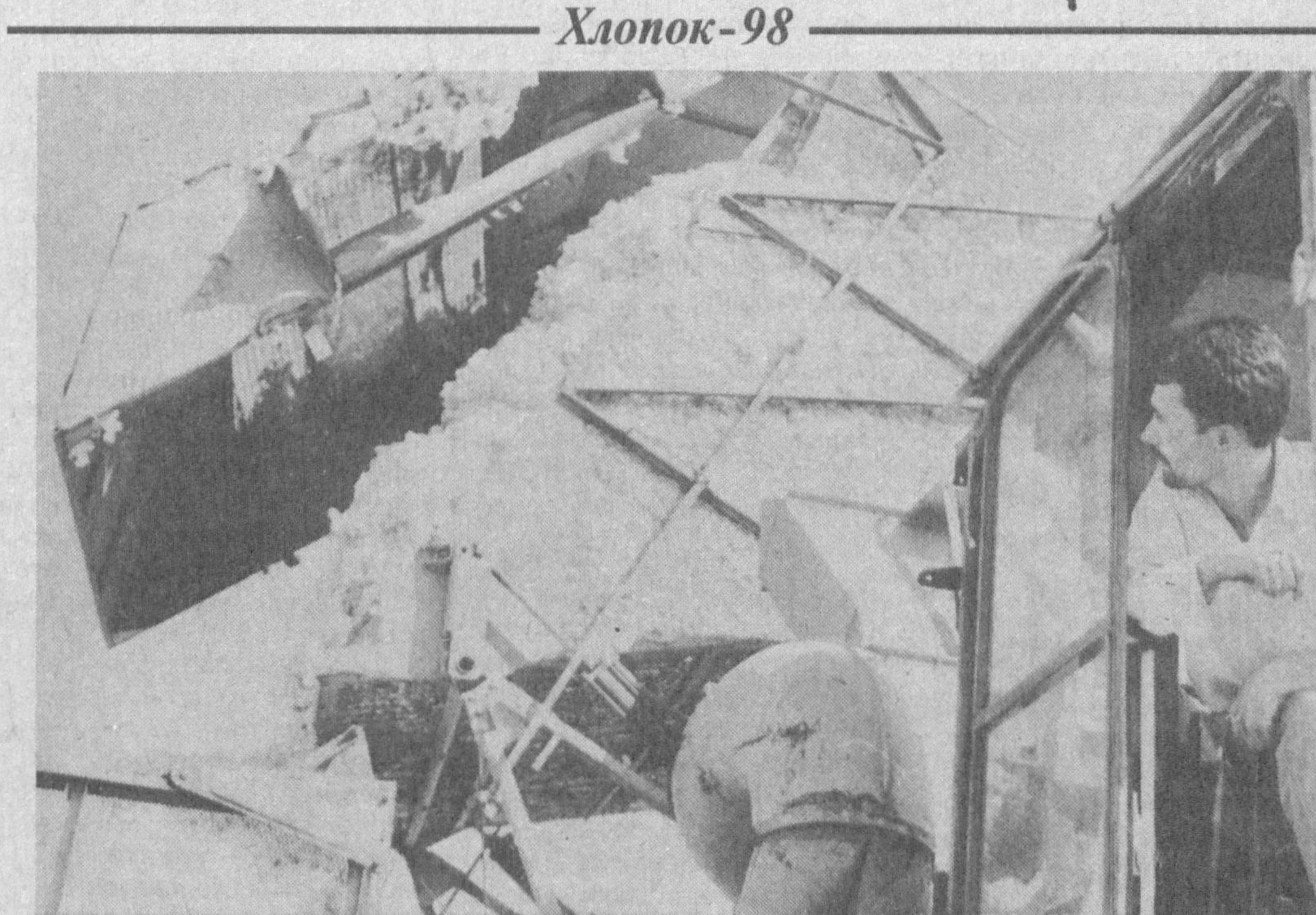
В нынешнем году АО «Дустлик» Юкочирчицкого района решило с каждого гектара получить не менее 30 центнеров «белого золота». Значительную часть урожая решено убрать машинами. НА СНИМКЕ: лучший механизатор акционерного общества Иком Маннасов.

Ввод в эксплуатацию ТАЕ-ВОЛС позволяет решить задачу перехода республики на современные цифровые системы связи, эффективно использовать построенные в Ташкенте и в областях местные и междугородные телефонные станции, развивать национальную сеть связи на базе новейших технологий.