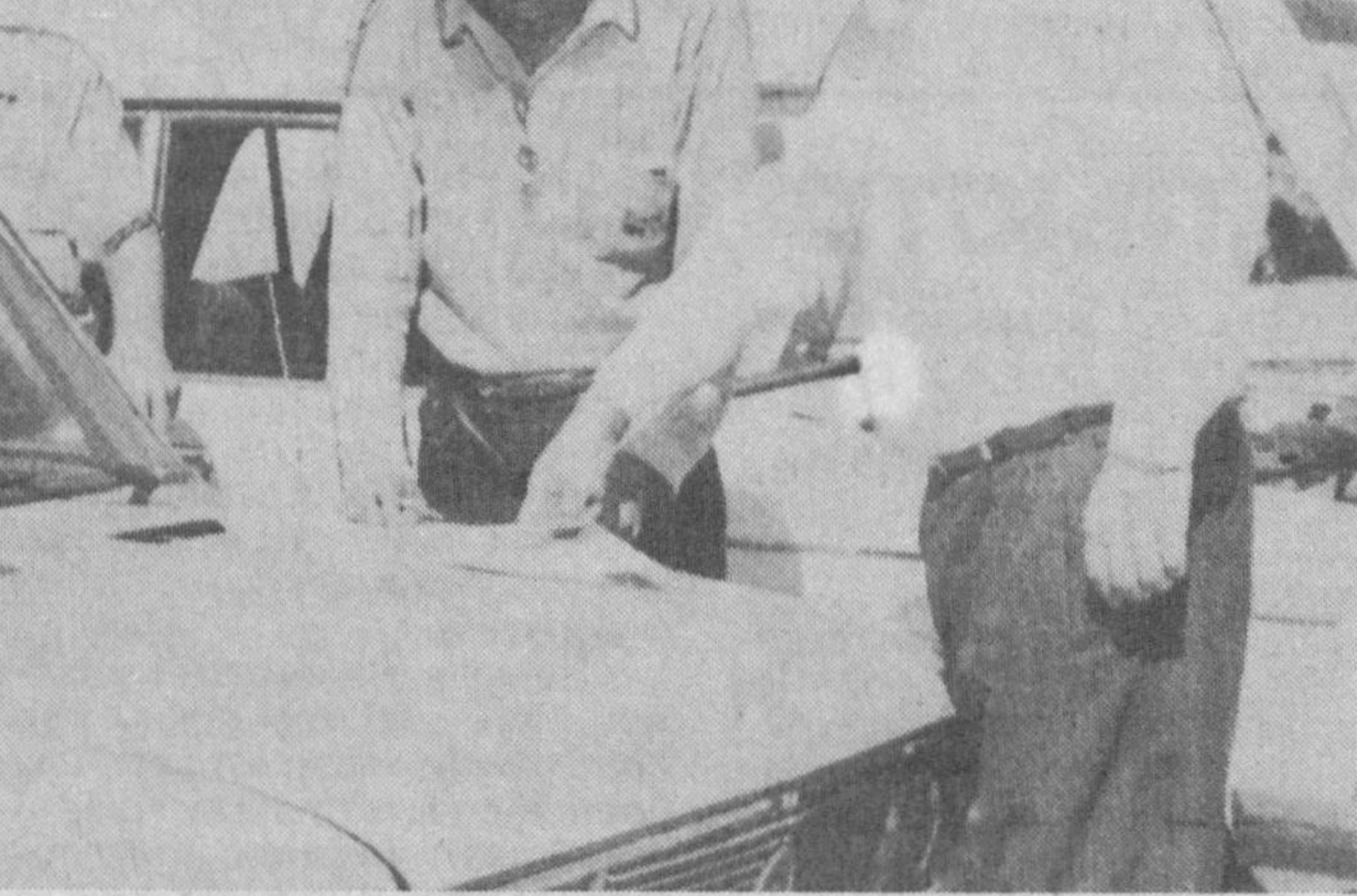
Ученики на занятиях в спортивно-техническом клубе.

напоминать сны столь же хорошо, как женщины, но даже помята сон, мужчине труднее говорить о нем. Партнеры по постели, как правило, видят сна одновременно. Героями мужских сновидений чаще становятся мужчины, а женщины видят во сне представителей обоих полов. Женские сны — «семейные» и более миролюбивые, мужские — агрессивные и меньше связаны с домом.